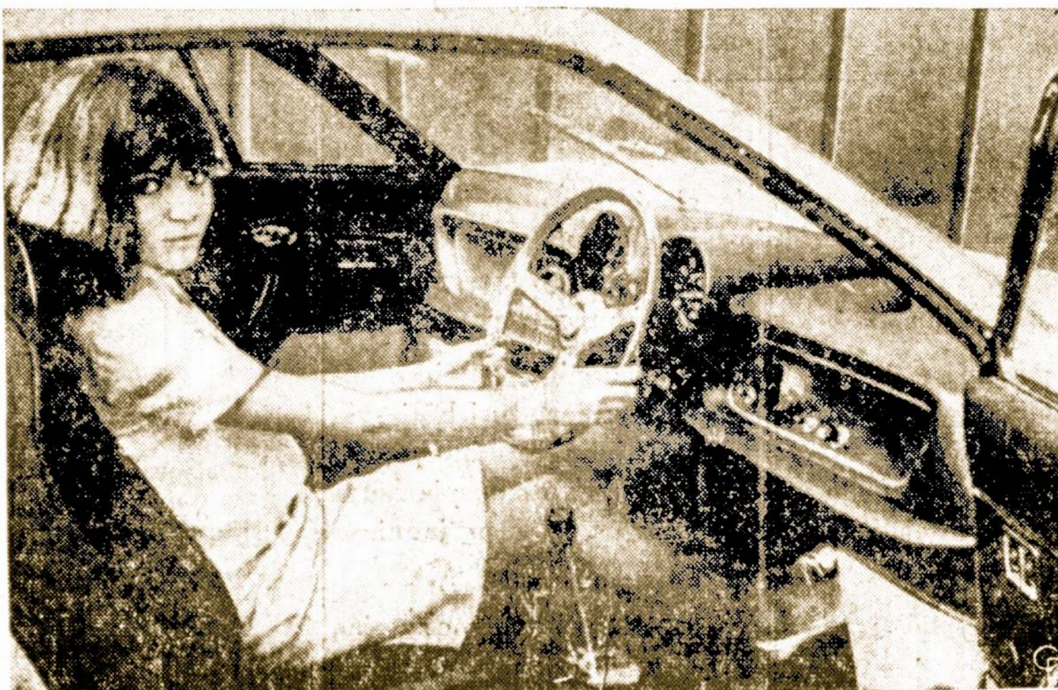
Paryžiuje automašinų parodoj demonstruojama mašina, kur vairavimo ratas yra ne kairėj pusėj, bet vidury mašinos.