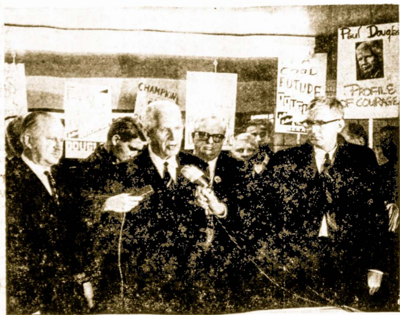
Senatorius Paul H. Douglas kalba lietuvių Demokratų susirinkime Chicagoje.

Lietuvių-Amerikiečių Komitetas Perrinkti Senatorių Paul H. Douglas