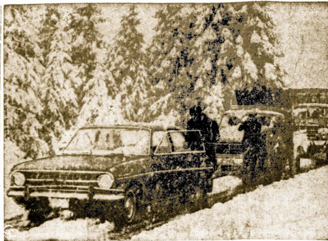
Mexico City iškrito nemaža sniego, tai šiame šimtmetyje jau ketvirtas kartas, pirmą kartą nuo 1940 m

Todėl, jei pajuntame kad burna dažniau "išdžiūsta", tai yra mažiau beatsiranda joje seilių, tai reikalinga atsikreipti prie