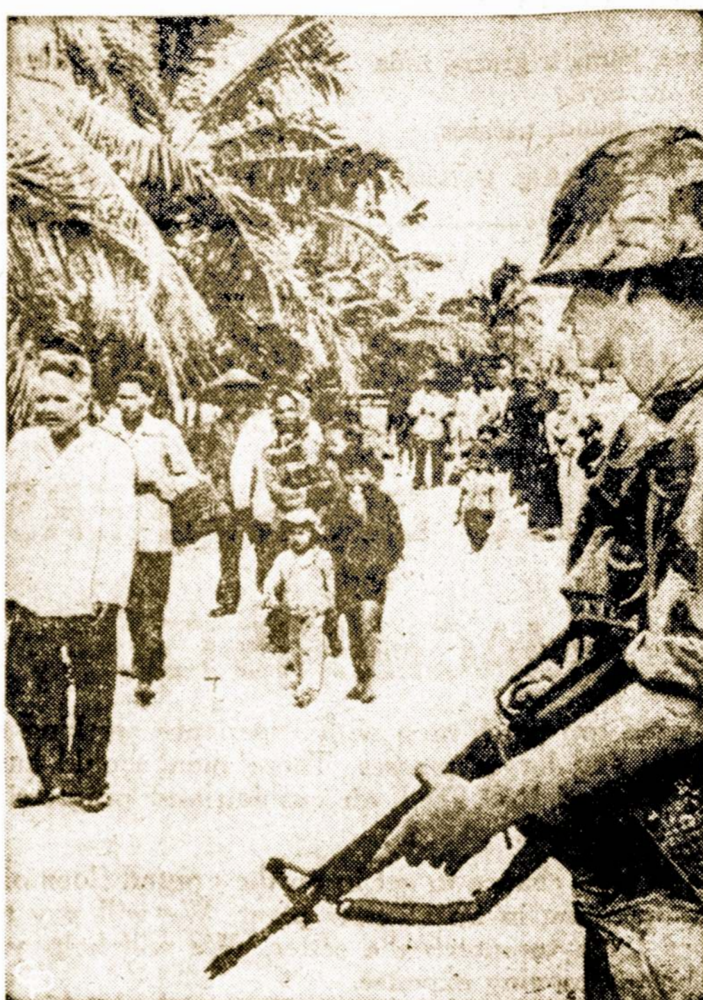
Amerikietis karys stebi evakuojamus gyventojus iš vadinamo geležinio trikampio netoli Saigono, kur labai daug prisilaikydavo komunistų. Iš 60 kvadratinų mylių ploto iškelta apie 10,000 gyventojų.