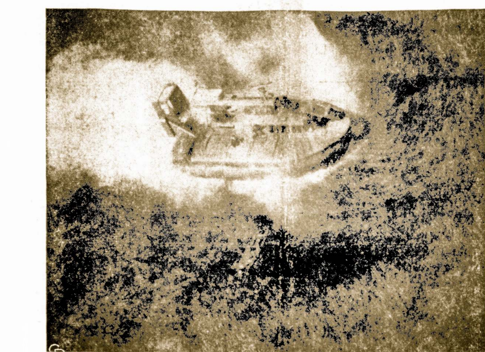
Amerikos laivyno vyrai Pietų Vietname pelkes valo Mekong deltoje specialiai pelkėmis važinėti laivais. Tokiais vežimlais, amerikiečiai labai lengvai gali išgaudyti pelkėse besislapančius komunistus. Čia netoli laivo matyti toks vienas raudonųjų laivelis, iš kurio iššokęs raudonųjų kareivis paimtas į nelaisvę.

Ar yra gyvybė kitose planetose? Tą klausimą dabar svarsto įvairios rūšies mokslininkai. Iki šio laiko buvo manoma, jog gyvybės egzistavimui Venus yra perkarštas, Marsas persausas, o Jupiteris peršaltas. Pastaroji, didžiausia planeta, yra 483 milijonus mylių atstume nuo galvinančios Saulės, tuo tarpu kai vidutinis Žemės atstumas nuo Saulės yra tik 93 milijonai mylių. Jupiteris yra apdengtas debesimis, kurių temperatūra siekia 300 laipsnių žemiau nulius. Bet, pasak mokslininkų, temperatūra po debesų turėtų būti aukštesnė ir prielanki kokios nors gyvybės pasireiškimui.