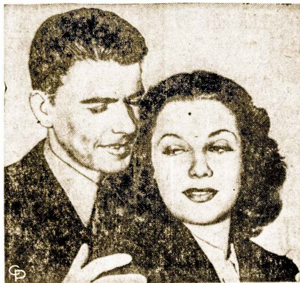
Dabartinis Kalifornijos gubernatorius Ronald Reagan buvo aktorius ir čia jis matyti filme, kuris buvo sukurtas prieš 25 m. Su juo čia jau mirusi aktorė Ann Sheridan filme "The Battle Cry of C'ty Hall"

Skolintas arklis ant lygaus kelio klumpa.