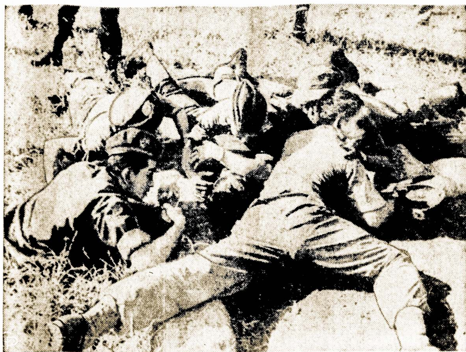
Palydovas apsaugojo vietnamiečių premjerą Ky. — Palydovas krito ant Pietų Vienamo premjero Ky. kai patrankos sviedinys klaidingai išsautas krito už kelių pėdų. Ky. pirmą kartą vizituodamas australiečių karių Nui Dat'e, stebėjo kaip veikia 81 mm. patranka.

New York. — Dantų gedimas dažniau pasireiškia negu paprasta sloga. Tikrenybėje, 19½ iš kiekvienų 20 amerikiečių — 95 nuoš. visu JAV-bių gyventojų — turi vargo su prakiurusiais dantimis, teigia American Dental Association.