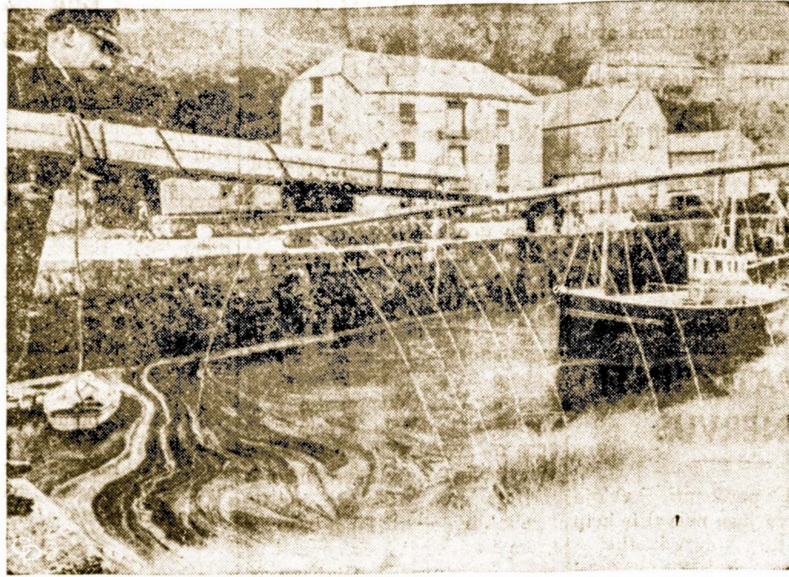
Prie Porthleven Britanijoje nuskendo amerikiečių tanklaivis Torrey Canyon ir išsiliejo alyva. Dabar britai norėdami išsaugoti 120 mylių balto smėlio papildymą, pila chemikalus, kad apsaugotų nuo alyvos.

Amžius stipruolį kupron suvaro, o guduolį vaiku padaro.