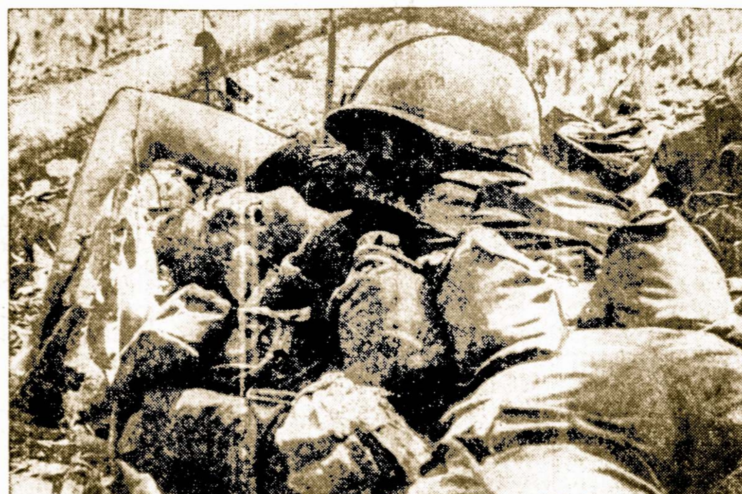
Kulkų spiečiuje savo kūnu dengia sužeistą draugą netoli Quan Loi. Pietų Vietname, apie dvi mylias nuo Kambodijos pasienio.

Jeigu taip iš tikro atsitiktų, tai geležinė uždanga tapų patostavia siena tarp laisvos ir pavergtos Europos.