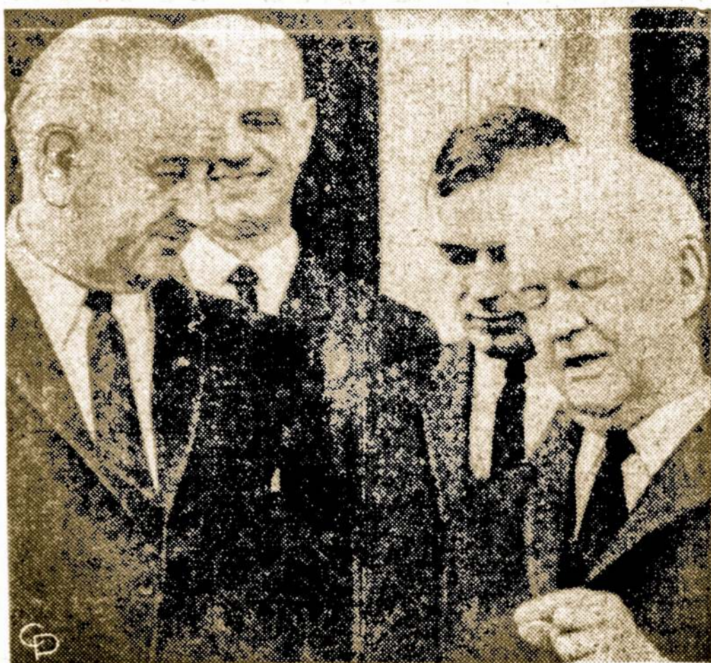
Prezidentas Johnsonas, atvykęs į buvusio Vakarų Vokietijos kanclerio Adenauerio laidotuves, kalbasi su Vakarų Vokietijos prezidentu H. Luebke (dešinėje) prezidentinėje rezidencijoje Bonnoje. Vakar iš Koelno katedros palaidotas žymus politikas ir valstybininkas Adenaueris

"Niekas nesupranta nei tapyboje, nei paveiksluose. Man visai nėra svarbu, kurie paveikslai yra geri ir kurie niekam tike. Bet aš pažįstu žmones. Ir žinau, kokius paveikslus, gerai pelnydamas, aš galiu parduoti. Štai ir visas reikalas."