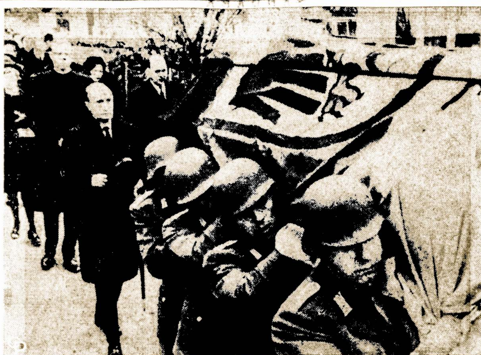
Pasaulio vadai dalyvauja Adenauerio laidotuviuose — Vakarų Vokietijos policijos pareigūnai neša buvusio kanclerio Konrado Adenauerio karstą iš jo namų netoli Rhenodorto į kancelarijos rūmus Bonnėje. Prez. Johnsonas atstovavo JAV-bes laidotuviuose, kurios įvyko bal. 25 d. iš garsiosios Koelno katedros.