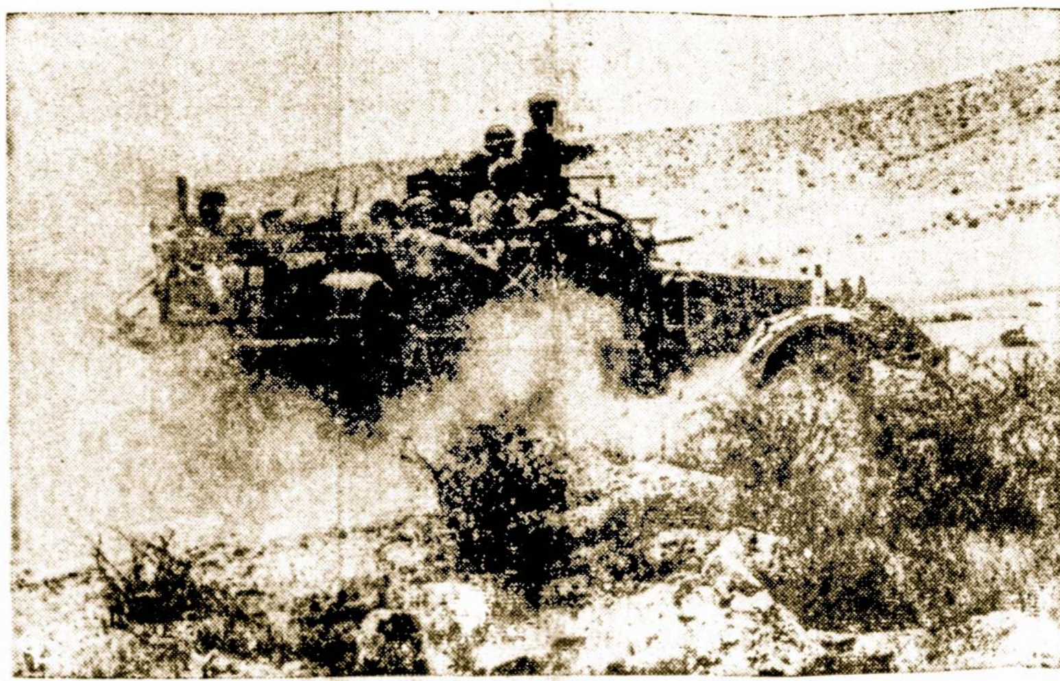
Izraelio armijos sunkvežimis netoli Negev dykumoje prie Egipto sienos.

Anglai turi gerą žvalgybą, kuri pirm laiko galėjo patirti kokią dieną ir valandą įvyks toji eksplozija. Britų valdžia netgi buvo įspėjusi Jordaną, kad jeigu jo kariuomenė bandys perkišti Izraelių, tai sutiks anglų pasipriešinimą. Bet vėliau, karui besivystant, anglai pakėitė tokį savo nusistatymą.