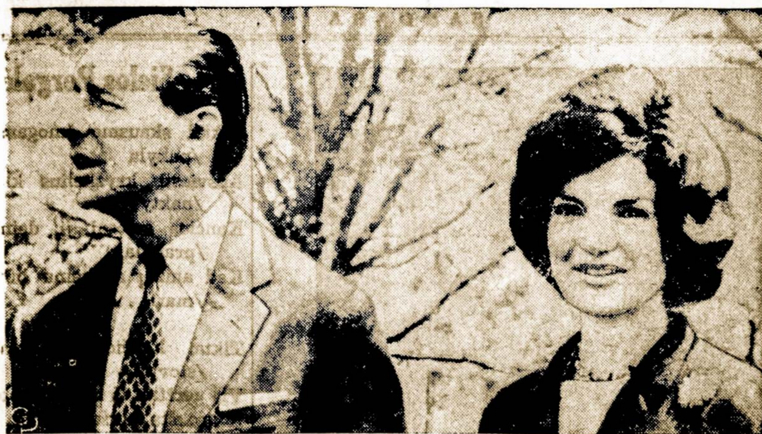
Kad lordas Harlech ir Jackie Kennedy gali susituokti. Jis buvo Britanijos ambasadorius Washingtono 1961-5 m. ir ši nuotrauka yra iš tų laikų. Lordas turi penketą vaikų. 13-26 m. amžiaus ir jau ikaičių. Jo žmona žuvo auto katastrofoje praėjusį pavasarį. Šie gandai paneigti.