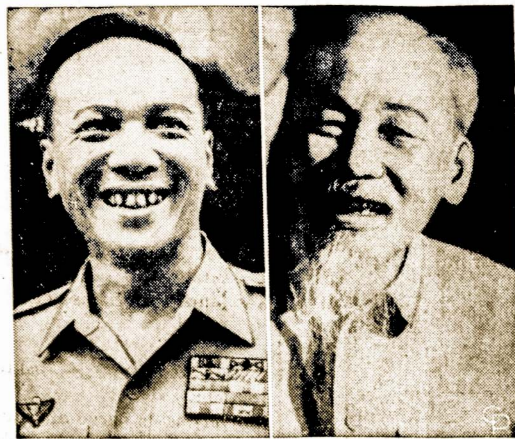
P. Vietnamo prezidentas Van Thieu (kairėje) tikisi gausių S. Vietnamo prezidento Ho Chi Minh (dešinėje) pakvietimą pasitarti taikos klausimais.

Daroma taip. Supiaustyti veršieną gabalėliais. Išleisti rieba-