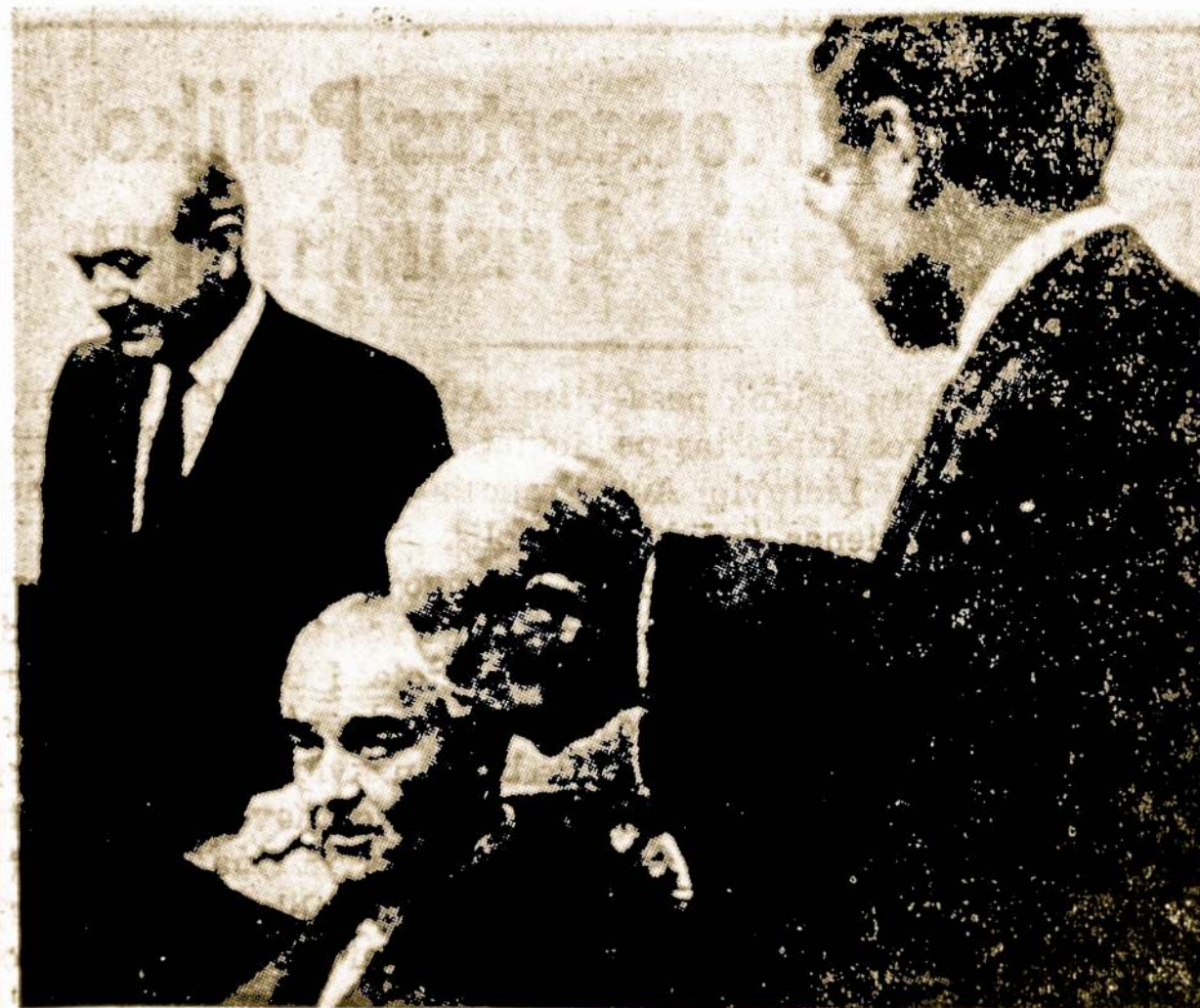
Washingtono vyko svarbūs pasitarimai. Čia prez. Johnson su savo patarėjais: iš kairės: — Rusk, Rostow ir McNamara.

Jis tvirtino ankstyvesnius tvirtinimus, jog cukrus, saldiniai ir kiti panašūs saldumynai, perdaug vartojami, yra kenksmingi dantims. Medus, tačiau, sudaro išimtį. Jis nekenkia dantims, nes yra natūralus produktas ir turi savyje subtanciją,