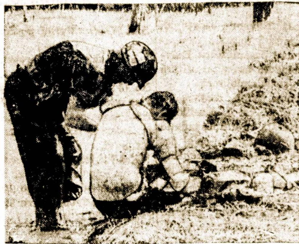
Amerikietis karys Vietname padeda savo kovos draugui, sužeistam prieš paslėptos minos.