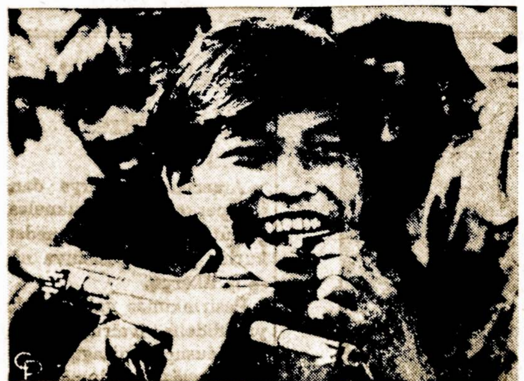
sls 14 m. Pietų Vietnamo karys šypsosi po kautynių netoli Loc Ninh.

Juo mažiau žmonės šneka, tuo geriau būna, nes pasaulyje yra per daug žmonių, kurie į daugybę žodžių įdeda labai mažai minčių.