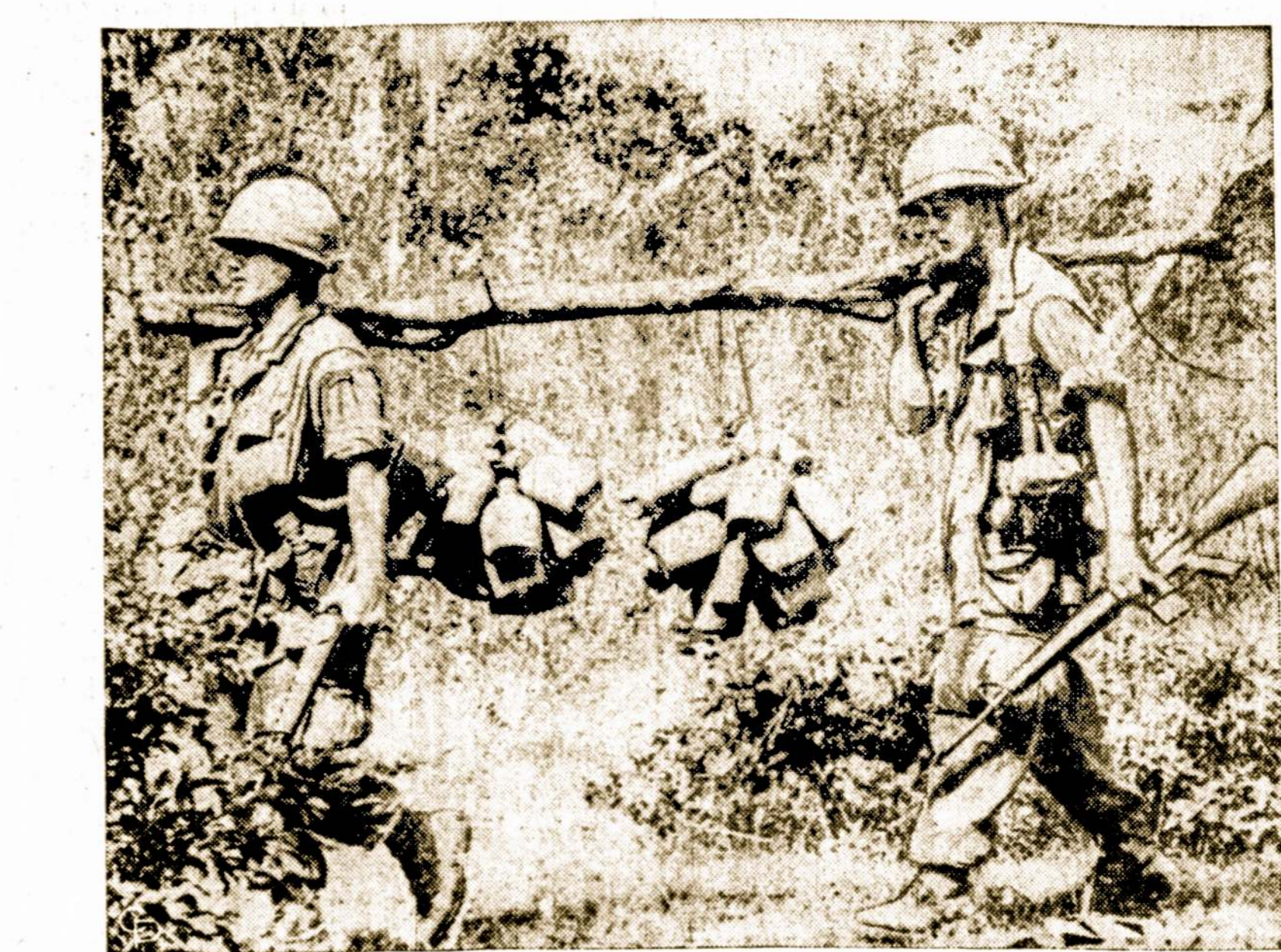
Du amerikiečiai kariai gabena vandenį Pietų Vietname, kur netoli Chu Lai vykdoma komunistų valymo operacija, vadinama "Operation Wheeler". Jie yra 101 diviziono kariai.

Vargšas Karolis! Kuomet visi jo mokslo draugai gali laisvai pasirinkti sau merginas — jis turi prisilaikyti aštrių suvaržymų ir kentėti dėl būsimos karūnos!