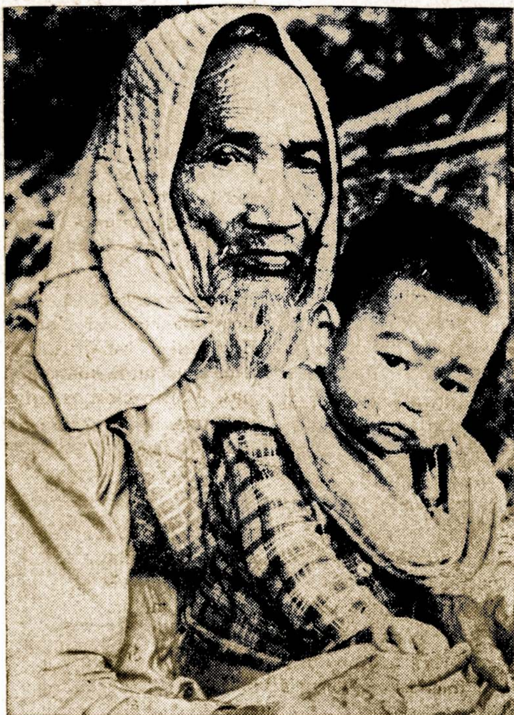
Netoli Da Nang bazės Pietų Vietname komunistiniai teroristai nusiaubė kaimą. Čia matyti komunistų išgąsdinti senelis su vaikučiu.

Laidotuvių išlaidos siekė 60 milijonų dabartinių dolerių.