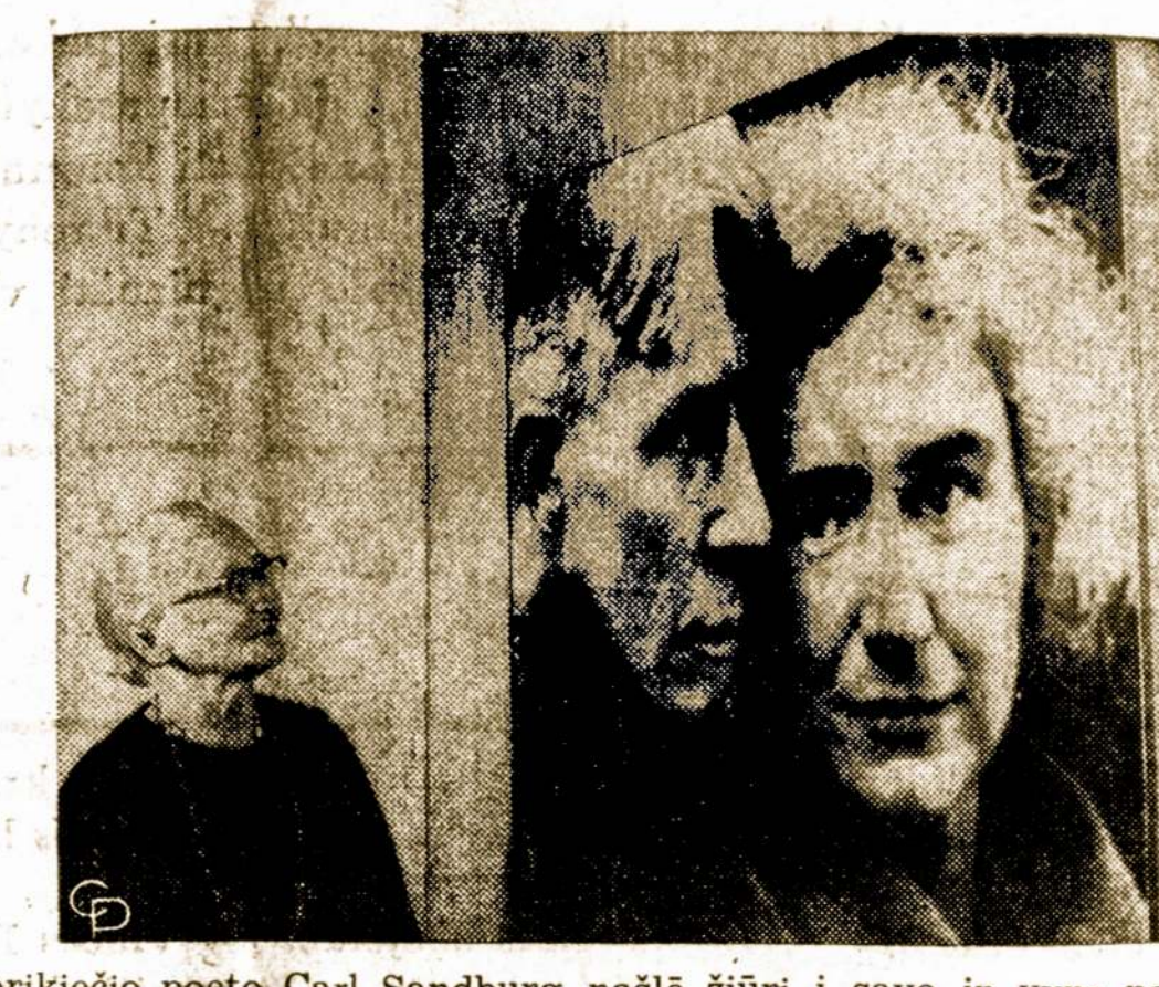
Amerikiečio poeto Carl Sandburg našlė žiūri į savo ir vyro paveikslą iš 1923 m. Hallmark galerijoj New Yorke. Paroda tęsis ligi vasario 29 d.

Kairas. — Turtingi aliejumi arabų kraštai, kaip: Saudi Arabija, Libija ir Kuwait pranešė Nasserui, kad jie nėra linkę toliau šelpti Egiptą. Pasėkoje to, Nasser noroms turės atidaryti Suez kanalą, bet ir tas ne kažin kiek suteiks jam jėgų, nes pasaulis yra mažiau linkęs naudotis tuo vandens keliu.