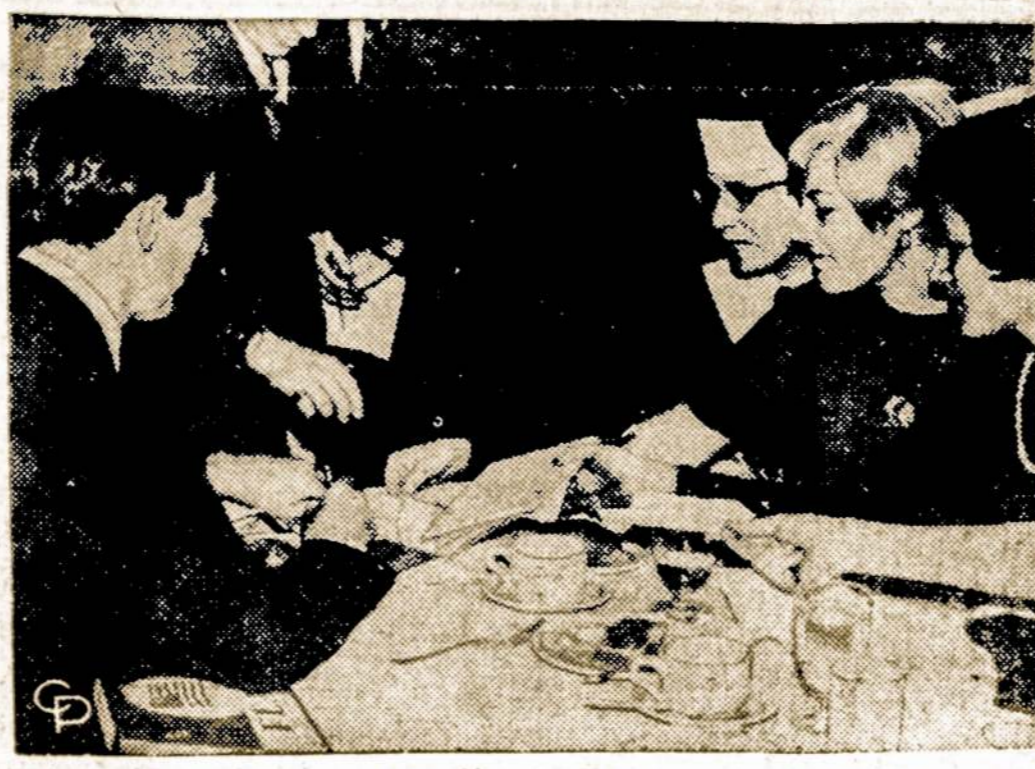
Dr. C. Bernard, širdžių perkėlimo specialistas, pasirašinėja autografus Chicagoje spaudos klube, prieš išskrisdamas į Portugaliją. Jis grįžęs vėl darysias keletą operacijų.

Svaiginamieji gėrimai, suvarloti didesniame kiekyje, naikina mūsų organizme vitaminus C ir B, o taip pat geležį. Ne ga-