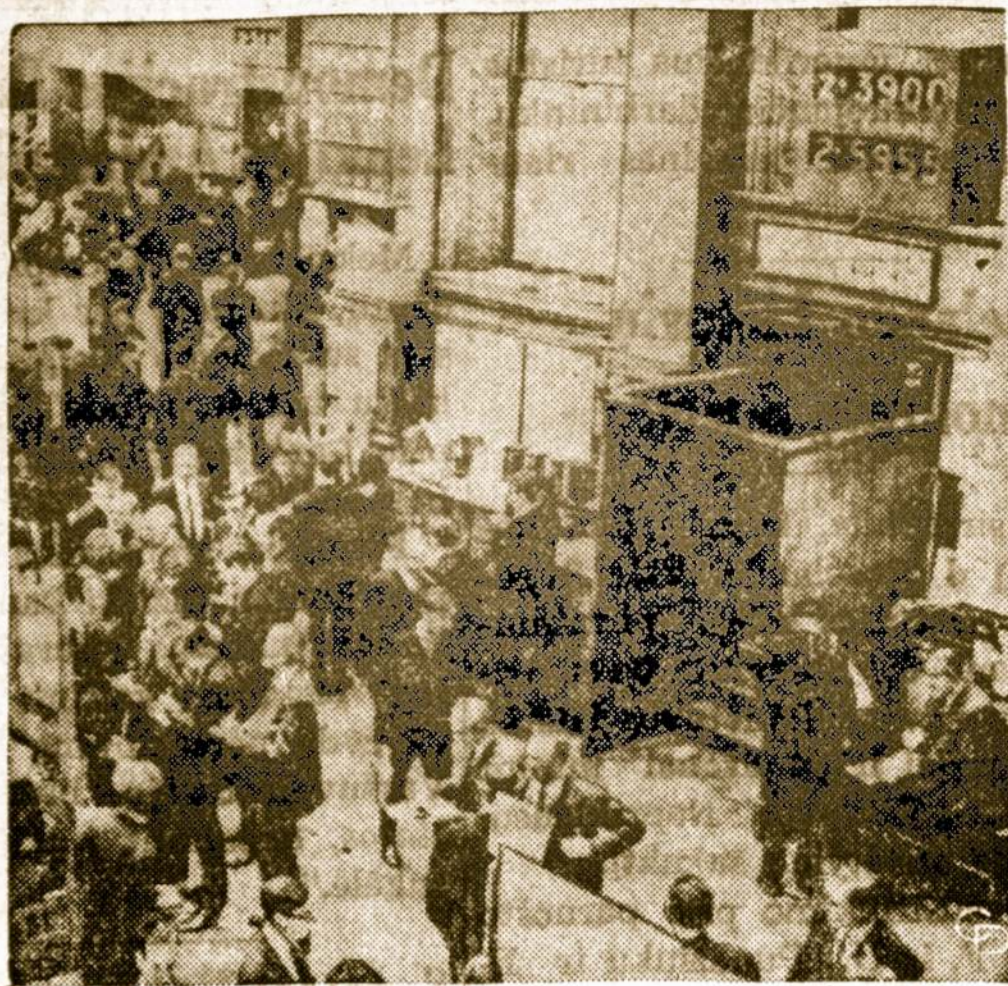
Taip atrodė praėjusią savaitę Londono birža — auksas pirktas karštai. Išiskai svaras buvo nukritęs ligi 2.39 dolerio kainos ir dar žemau.

Reikia pamti 3 puodukai kvietinės džiovintos duonos trupinėlių (cracker meal), 1 šaukštą smulkiai sukaptotų svogūnų, 1 šaukštuką druskos, ketvirtadalį šaukštuko pipirų, puoduką sukaptotų obuolių.