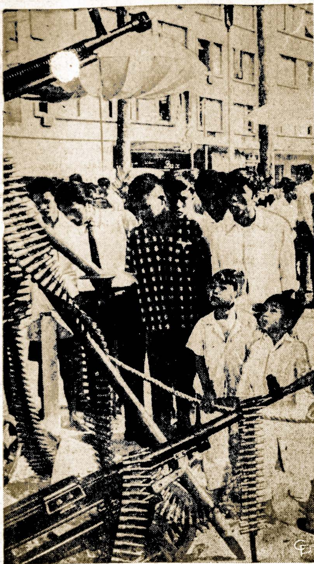
Penų Vietnamo vaikučiai Saigone stebi komunistinius ginklus, išstatytus Saigono gatvėje.