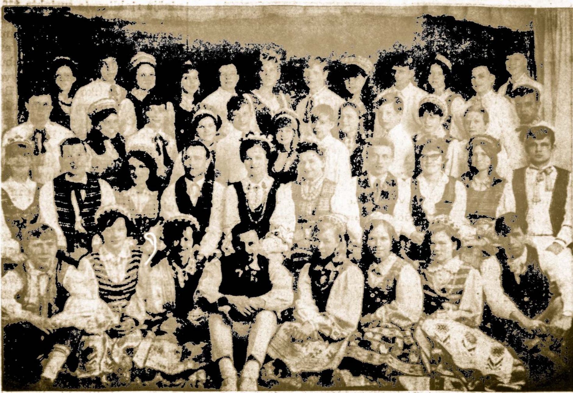
Bostono lietuvių tautinių šokių sambūrio dalyviai, vykstantieji į III-ąją lietuvių tautinių šokių šventę Chicagoje.

Kitą įrodymą patiekė tie asmenys, kuriems operacijos keliu buvo nupiauti nerviniai junginiai tarp vieno ir antro smegenų pusrutulio. Pasirodė, jog kiekviena iš tų dalių savystoviai veikė, tartum būdamos dvi atskiros smegenys.