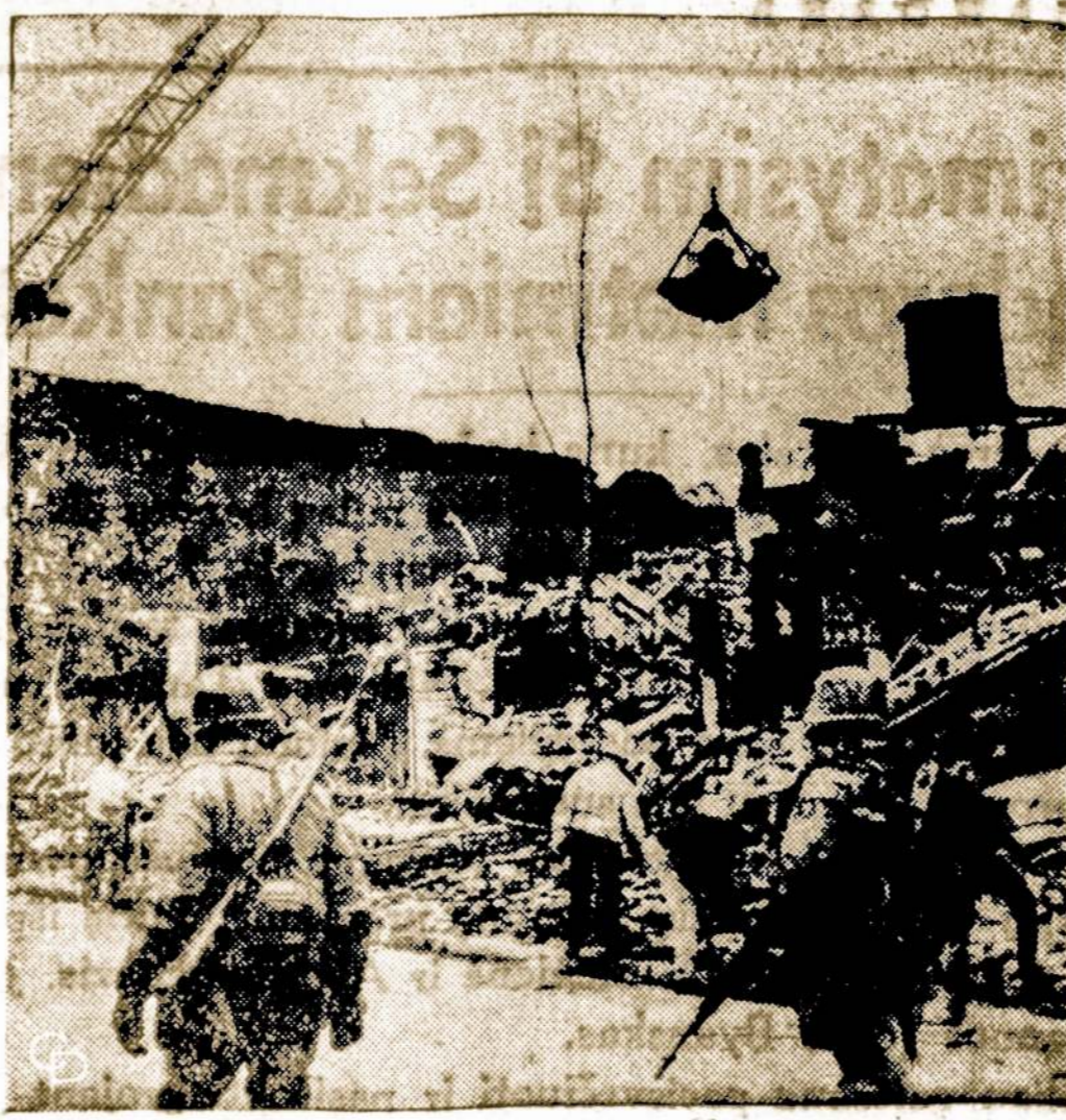
Washington atstatomas miestas, kuriame juodieji gyventojai sudegino eilę pastatų.