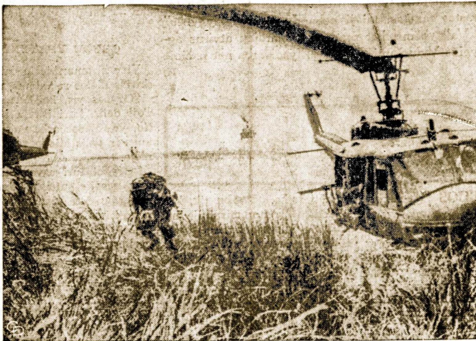
Amerikiečiai, vykdydami Pietų Vietname Complete Victory operaciją, valo kraštą nuo komunistų. Apie 100,000 vyrų valo nuo komunistų 11 provincijų, supančių Saigono miestą.

Per tą savaitę Washingtono, D.C., mokyklose juodukams vaikams buvo patiekta uždavinys — parašyti ką jie mano apie įvykusias sostinėje riaušes. Atsakymų buvo tokių: „Baltieji žmonės užmušė Martin Luther King be jokios priežasties. Gerai pasielgta sunaikinant baltųjų žmonių krautuves.“ „Dėl to, kad jis buvo nušautas, nereikėjo sukelti riaušių. Padegėjai sunaikino nuosavus namus. Juodukai turėjo pasirodyti su sąsara, o ne su piktumu.“ Vaikai taipgi buvo paklausti, ką jie darytų, jei būtų balti žmonės. Štai keletas atsakymų: „Aš parbėgčiau į savo namus, uždaryčiau duris ir langus... išsikelčiau iš Washingtono... pakelsčiau save į juoduką.“