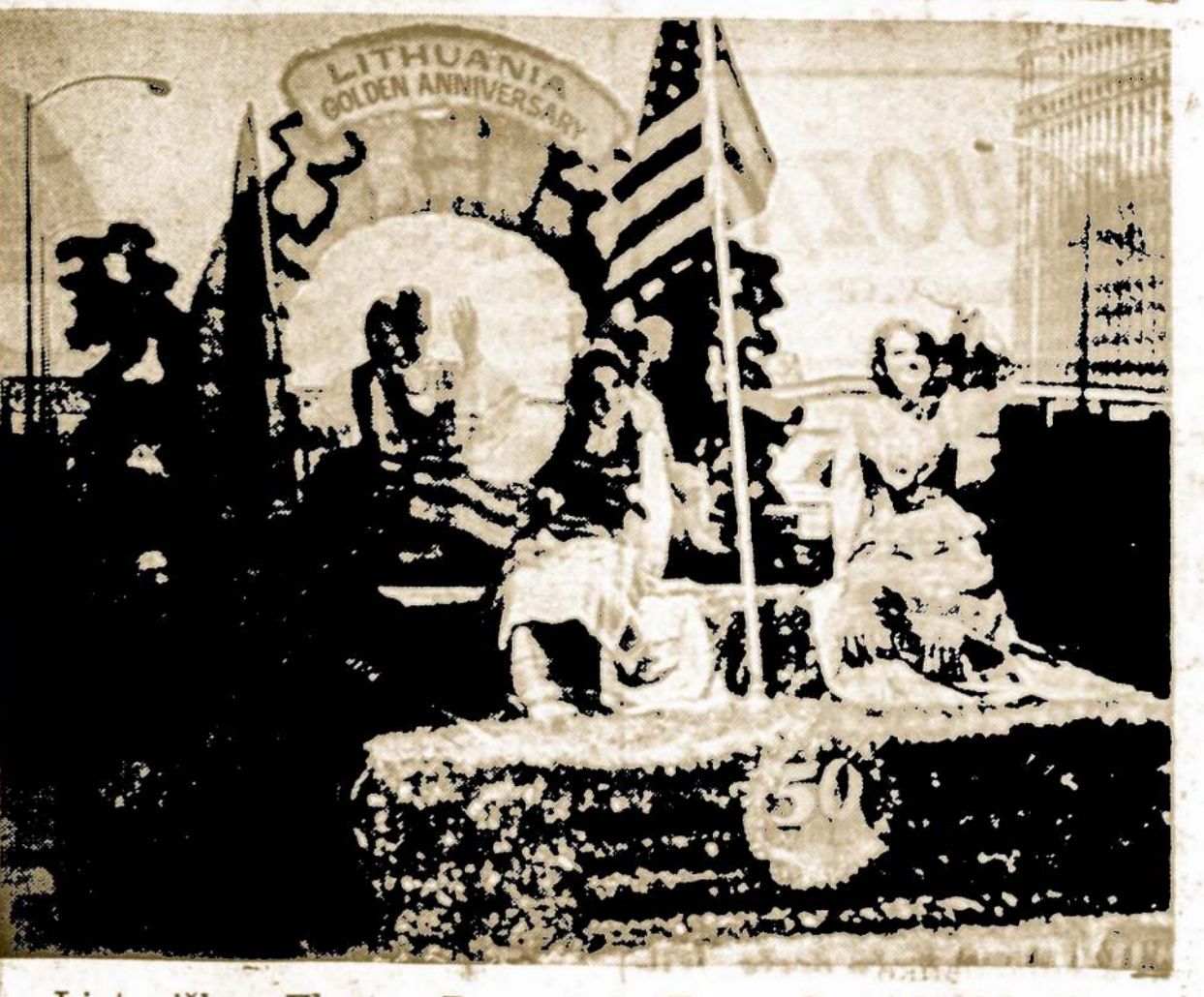
Lietuviškas Floatas Pavergtų Tautų Savaitės Manifestacijos Perteitą Šeštadienį, Chicagos Vidurmiestyje.