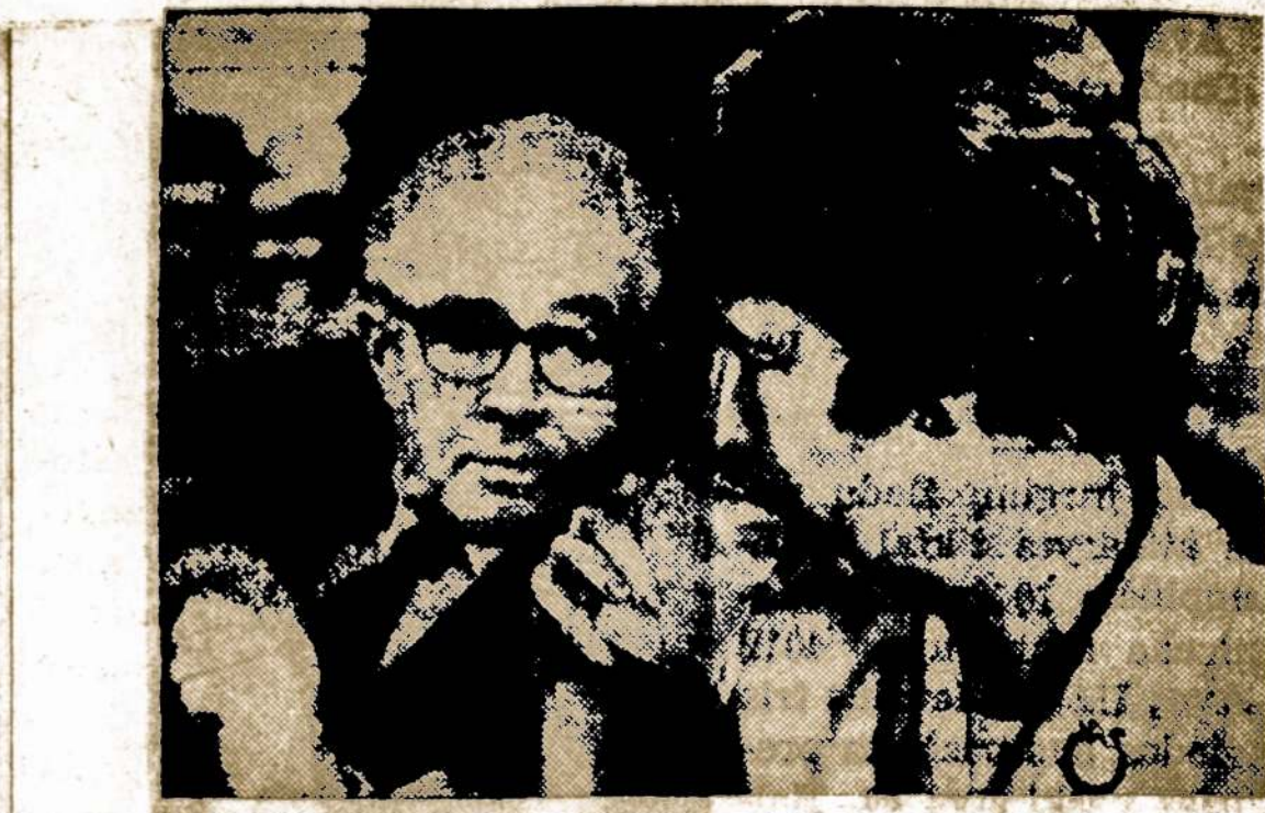
Teisejas Homer Thornberry su žmona Washingtono po senato teisinio komiteto apklausinėjimo dėl jo nominavimo į JAV aukščiausią teismą.

CHILD CARE —Mature Woman to live in. 2 children. No household duties. Refs. required. Lombard. Call 9 to 2 p.m. 629-5773.