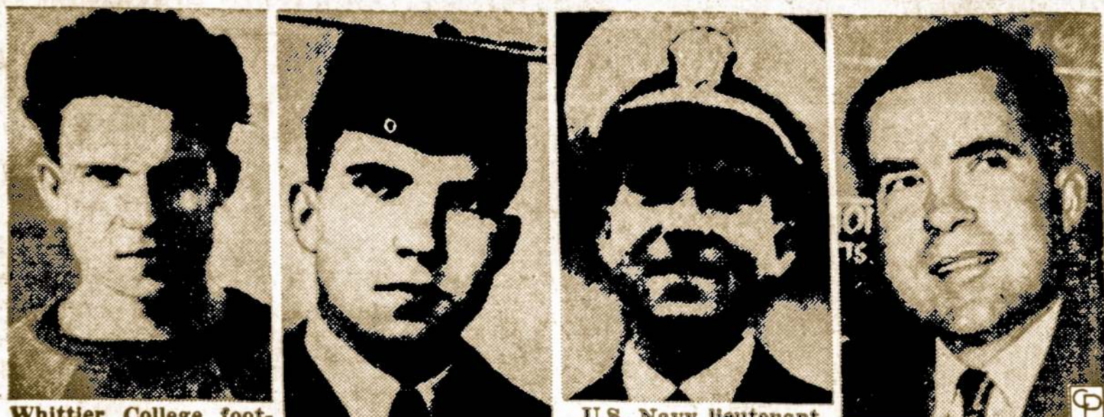
Whittier College football team in 1933. Whittier grad in 1934. (J.G.) in 1942. Senate candidate 1950.

"Jei viskas gerai klosis — būsi laimingas, jeigu ne, tai tapsi filosofu".