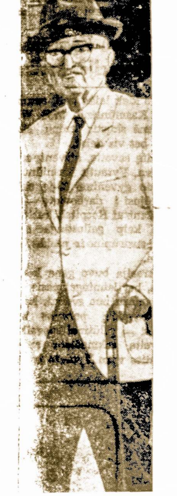
Paskutinė buv. JAV Prezidento Harry Trumano nuotrauka, daryta prie jo namų Independence, Mo.