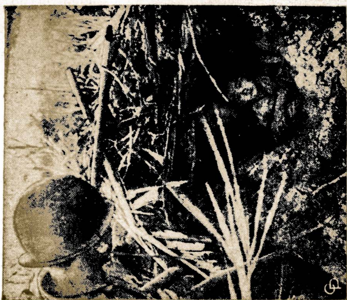
Vietnamo karo pragare. Motina ir sūnus slapstosi nuo komunistų sviedinių Mekongo deltos srityje.

— Šitaip? Tai labai malonu susipažinti. Aš esu jo motina.