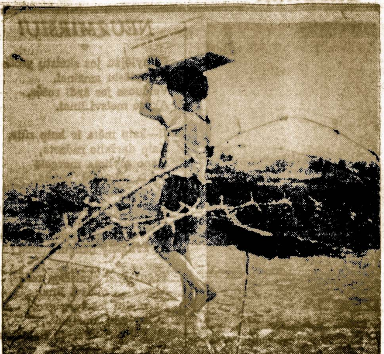
Karai ir saldiniai. Pietų Vietnamo berniukas eina per spygliuotų vielų užtvaras prie Pleiku miesto, nešdamasis saldumynų dėžę, kurią jam dovanavo kariai amerikiečiai.

Mūsų kūnas turi apie 2 milijonus prakaitavimo liaukų (glands), kurios reguliuoja kūno temperatūrą ir pralalina kenksmingą nusidėvėjusią me-