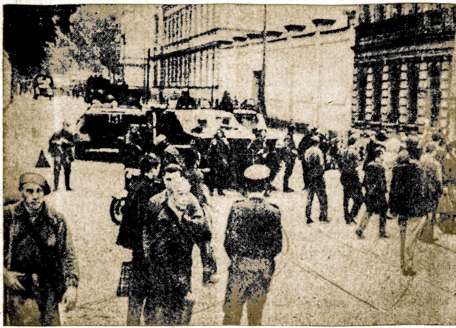
Prahos gatvėse čekoslovakai stebi vergiją ir terorą nešančius Maskvos tankus.

Daugiau kaip 30 čekų rašytojų, atvykusių iš savo krašto į Austriją, buvo susirinkę Vienos viešbutyje ir priėmė manifestą.