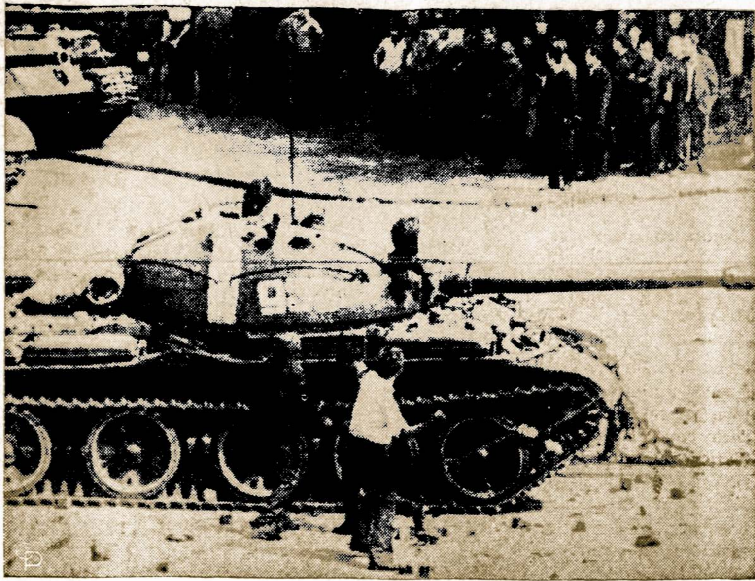
Gyventojai Bratislavos mieste Čekoslovakijoje graso tankais važiuojantiems imperialistinėms Sovietų Rusijos kareiviams.

Londono laikraštis "The Daily Telegraph" tikina, jog Sovietų Sąjungos ir jos satelitų užpuolimas ant Čekoslovakijos parodė, visam pasauliui, jog komunizmas gali valdyti užgrobtus kraštus tik su pagalba "kareivio durtuvo ir tanko".