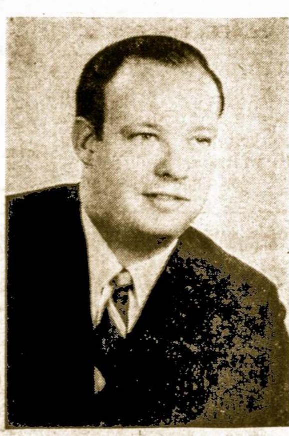
E. SCHOLL CLERK CIRCUIT COURT