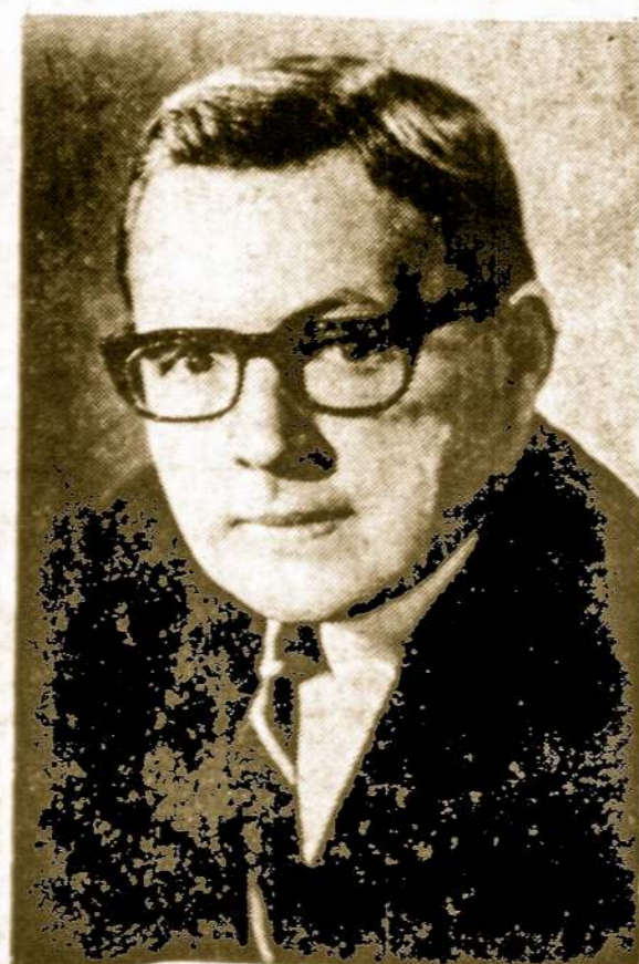
R. B. OGILVIE GOVERNOR

Tik Balsuodami už Respublikonų Partiją Mes Užsitikrinsime TAIKĄ, TVARKĄ, SAUGUMĄ IR SAŽININGUMĄ!