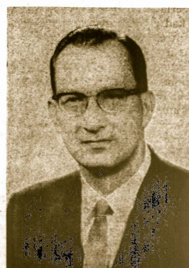
A. VALUKAS JUDGE CIRCUIT COURT