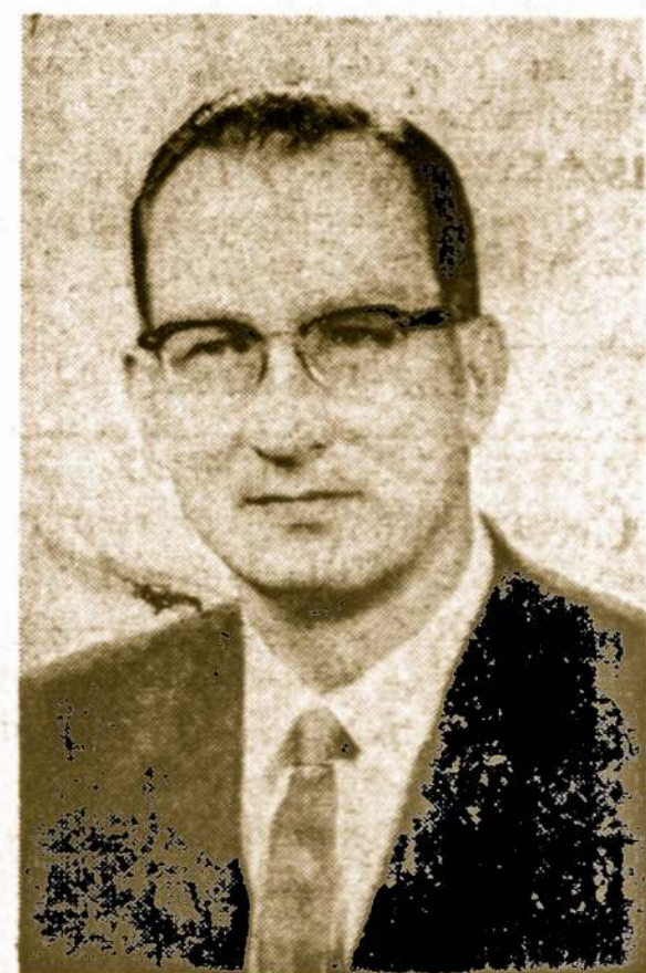
A. VALUKAS JUDGE CIRCUIT COURT