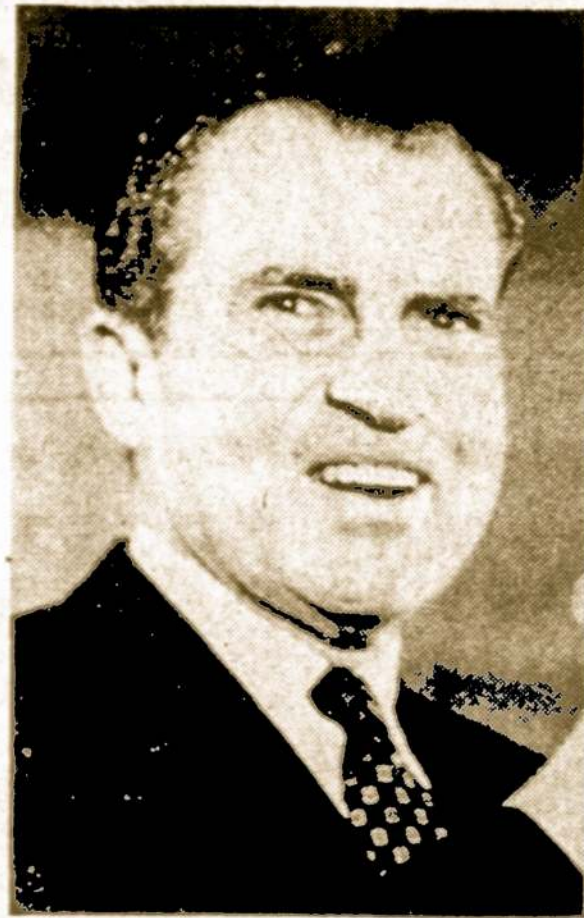
R. M. NIXON PRESIDENT

Tik Balsuodami už Respublikonų Partiją Mes Užsitikrinsime TAIKĄ, TVARKĄ, SAUGUMĄ IR SAŽININGUMĄ!