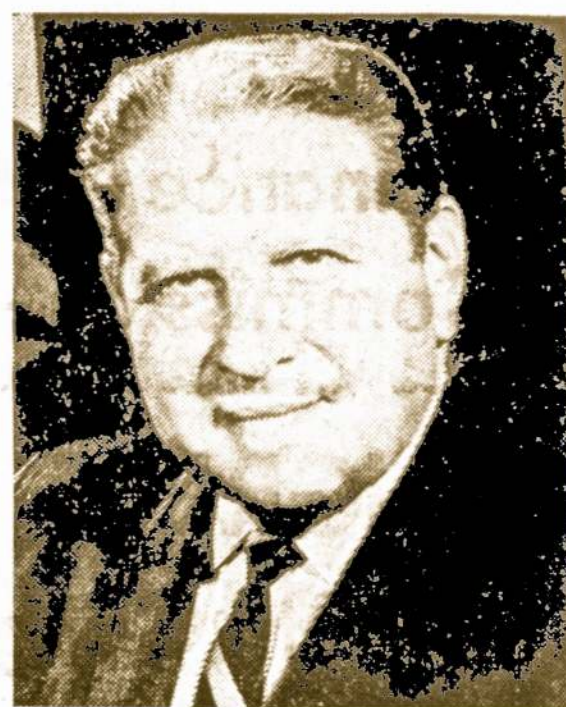
Perrinkite SAMUEL H. SHAPIRO Governor