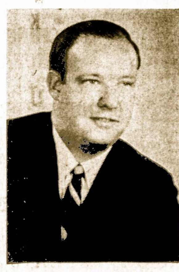
E. SCHOLL CLERK CIRCUIT COURT