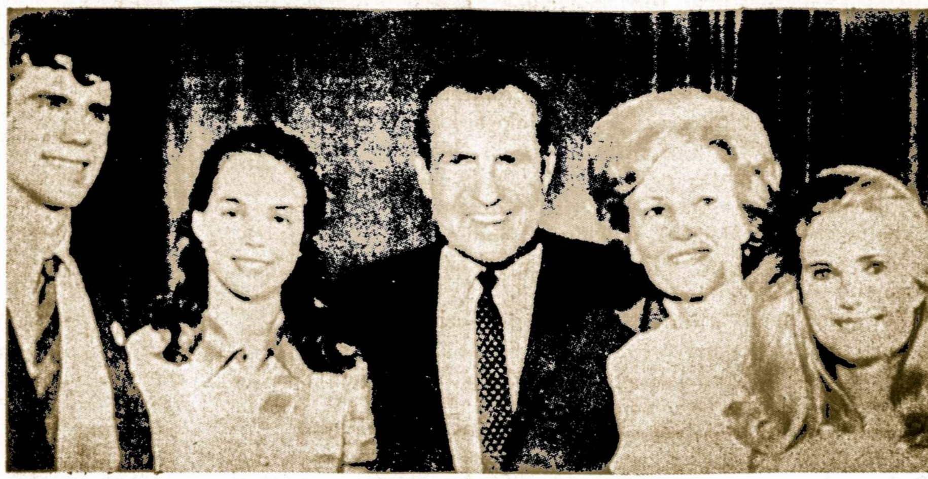
37-asis JAV prezidentas R. M. Nixon savo šeimos tarpe: iš kairės būsimas žentas David Eisenhower, b. prezidento anūkas, duklė Julie, pastarojo sužadėtinė, būsiamasis prezidentas, žmona Pat ir duklė Tricia.

Pasirodžius 1883 metais laikraščiui "Aušrai" jis bendradarbiavo joje ir platino ją tarpe Latvijoje gyvenančių lietuvių. Kai rusų policija pradėjo jį persekioti, tai 1885 metais jis persikėlė į Šiaulius, kur išgyveno iki pat mirties.