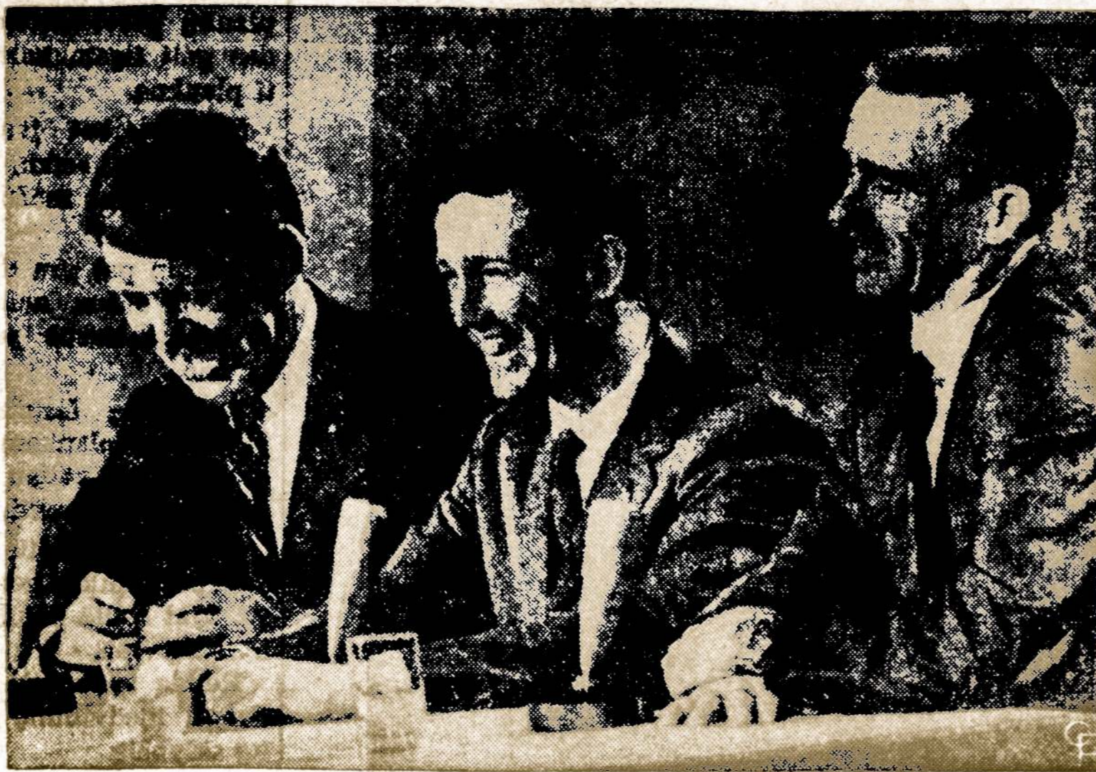
Apollo 7 astronautai, iškę erdvėmis 11 dienų, Cunningham, Schirra ir Eisele, pasirodė televizijos programoje, kur Cunningham pareiškė, kad rusai jaučia jog ateina lemiamos valandos ir, kad jie neturi pirmenybės lenktynėse į erdves. Amerikiečiai gruodžio mėnesį išlėks kelionei apie mėnulį.