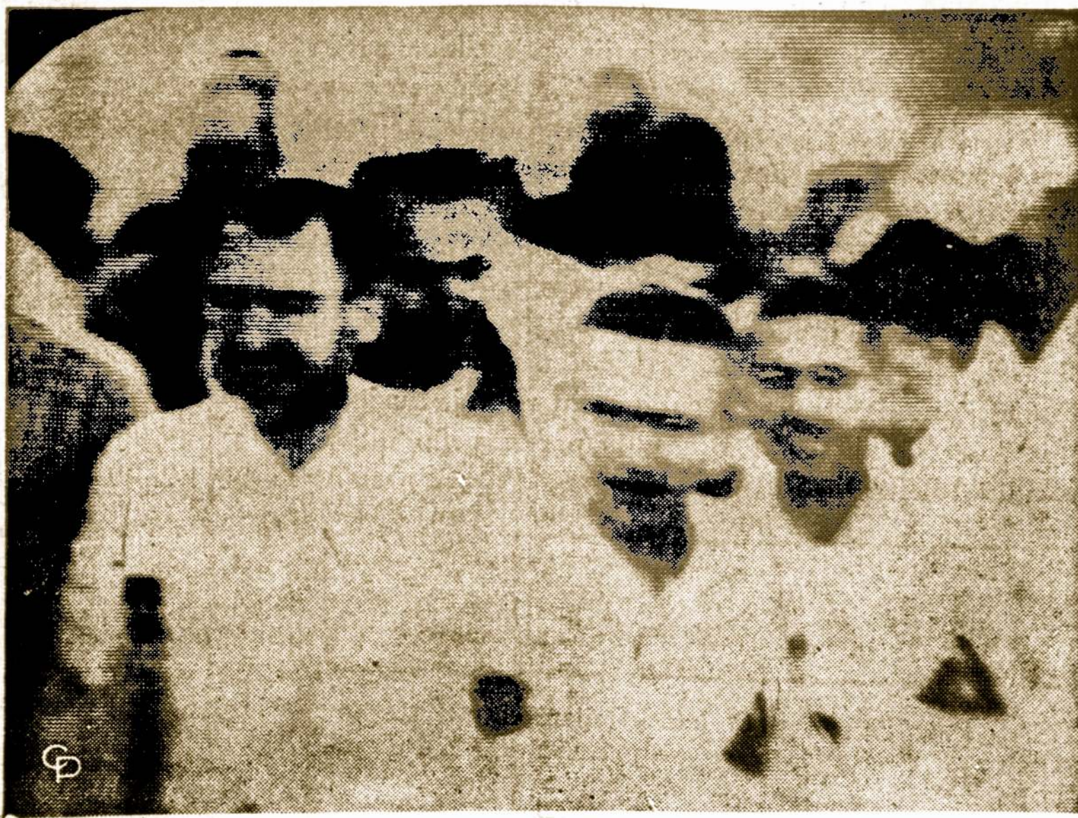
Sugrįžę iš kelionės apie mėnulį astronautai James Lovell, Frank Borman ir William Anders

Taigi, jeigu amerikiečių spauda jau taip nusiskundžia, tai ką bekalbėti apie lietuvišką, kuri verčiasi žymiai blogesnėse sąlygose?