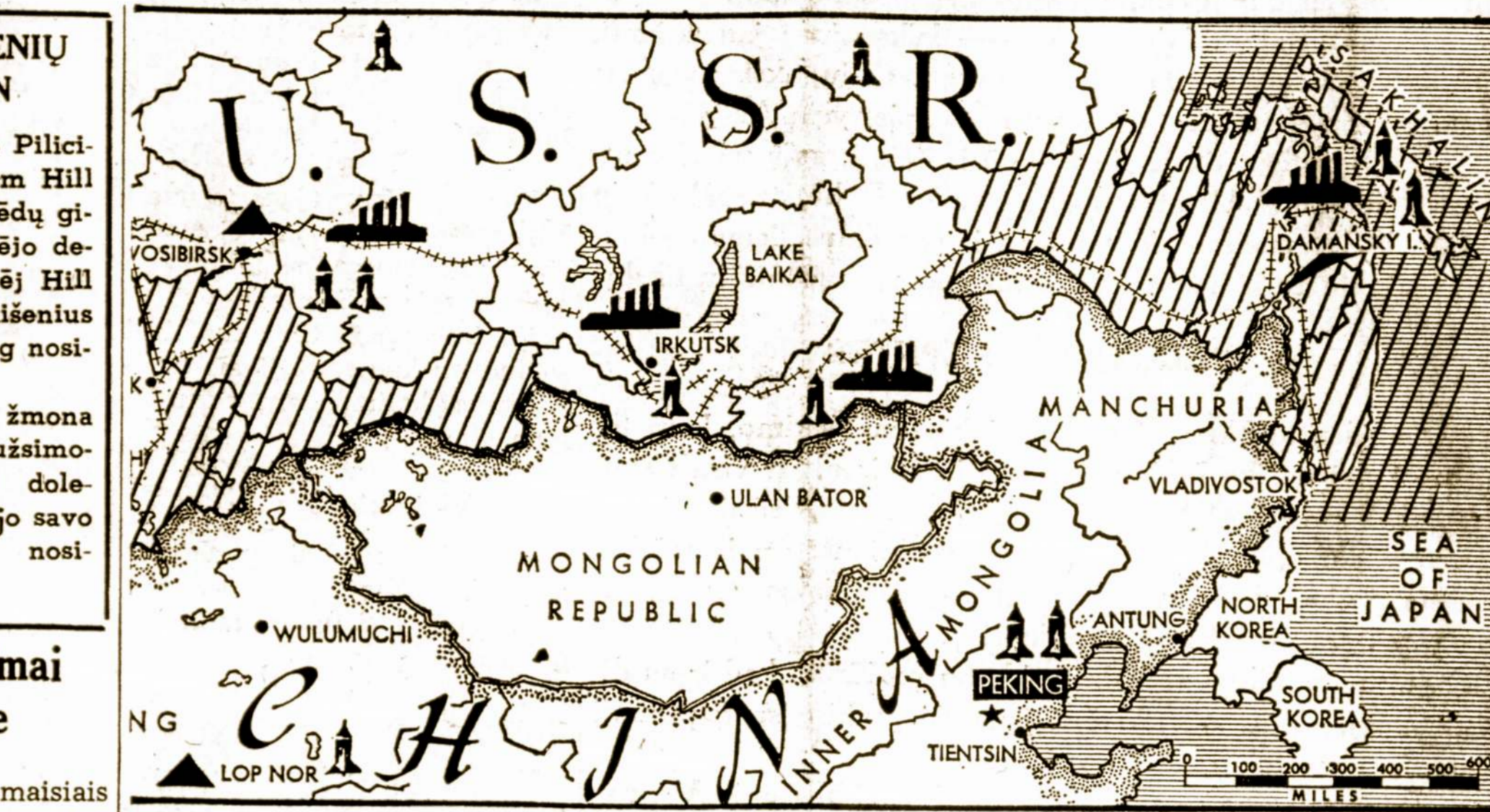
Istriai pažymėtos sritys Sibire. Kinai teigia kad jos neteisėtai valdomos rusų ir priklauso Kinijai. Aukštai dešinėje Damanskio Usurio upėje.

Vargiai atsiras kitas vadas jį panašus, ir toli gražu nelygus jam nei ryžtumu, nei jo tikėjimu Prancūzijos didingumu, bet jo melle lydint tautą pergalėn.