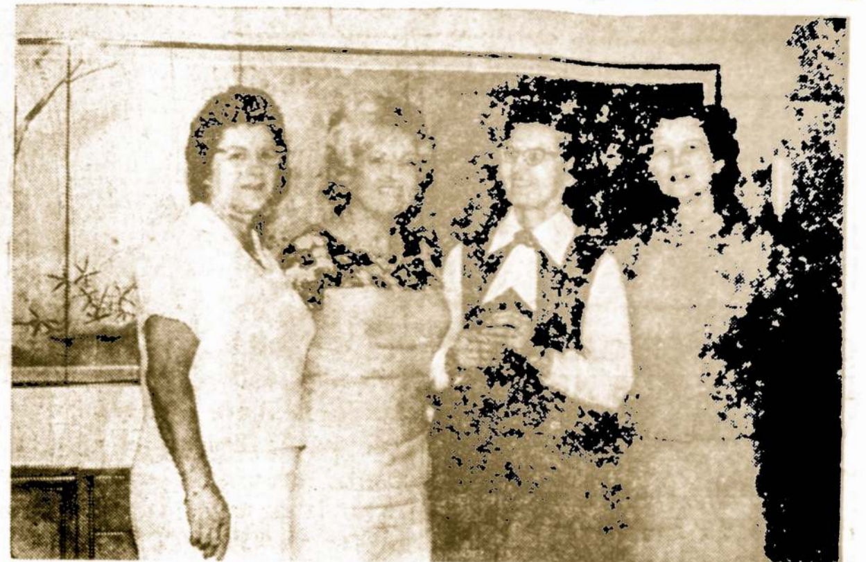
Balandžio mėn. 24 d. ponų Balzekų rezidencijoje įvyko Balzeko Lietuvių Kultūros Muziejaus Moterų Vieneto steigiamasis posėdis, dalyvaujant 22 ponioms.

Aš žinau kitą atsitikimą. Jam teko dirbti School of Nursing patalpose, kur buvo daromi