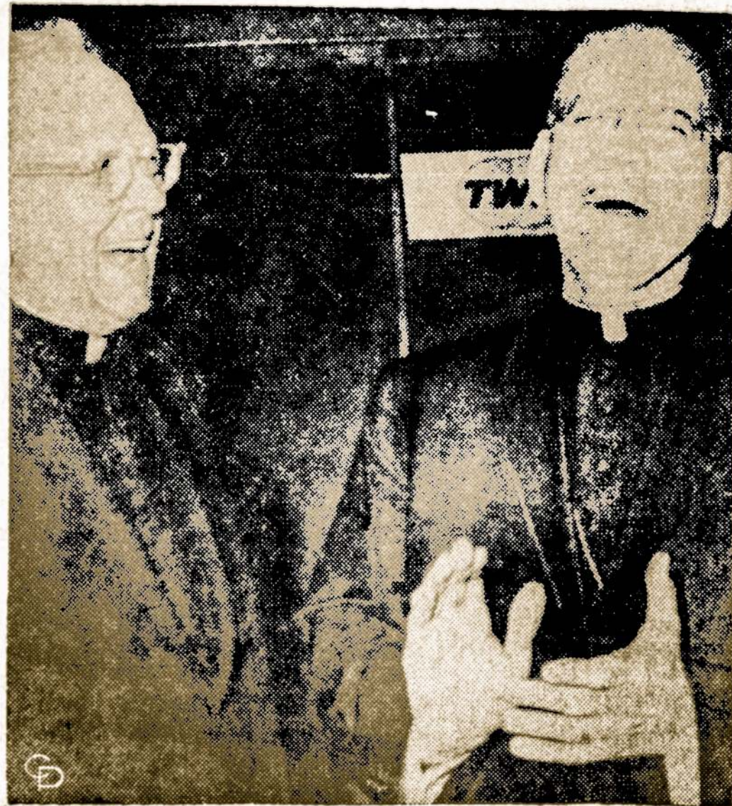
Neseniai pakeltas kardinolu. — New Yorko ark. Terence J. Cooke (dešinėje) ir Los Angeles ark. McIntyre syposi. Neseniai Sv. Tevas Paulius VI pirmajam suteikė atitinkamas insiginjas.

Gerai išvalytus ir išplautus grybus išvirti. Paskiau juos permalti per mėsos malimo mašinėlę. Pridėti smulkiai supiaustytus ir svieste pakepintus svogūnus, vieną kiaušinių ir truputį miltų, kad masė laikytųsi. Įberti dar truputį druskos, pipirų ir viską gerai išmaišius — daryti nedidelius kotlietukus. Apvynioti pyrago džiūvėseliuose (bread crumbs) ir pakepinti keptuvėje — svieste ar margarine. Geometrijoje nėra atskiro kelio karaliams. —Euklidas Pasulyje yra daugiau kaip 15,000 skirtingų rūšių vynu.