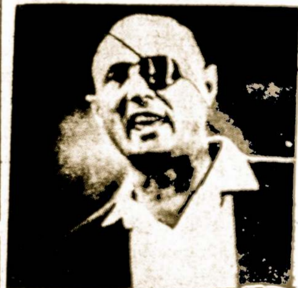
Moise Dayan grasina arabams: Izraelis galįs pradėti ofenzyvą...

JERUZALĖ. — M. Dayan, Izraelio gyn. vadovas, kalbėdamas Tel Avive, įspėjo: Izraelis galįs griebtis ofenzyvos veiksmų tuo atveju, jei arabai toliau tęstų jų puoluosius veiksmus. Dayano nuomone, tai būtų gynybos ofenzyvos karas, tačiau, kad, "aš nesu tikras, kad mes galėtume likti gynybos padėtyje".