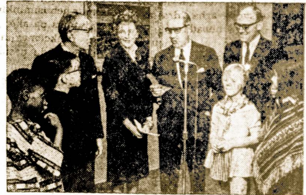
Neišsivysčiusių kraštų vaikų pagalbai Jungtinės Tautos skiria 7.7 mil. dol. Čekų laiko Jungtinių Tautų vaikų fondo pirm. Henry Labouisse. Kairėje matyti Jungtinių Tautų sekret. U Thant.