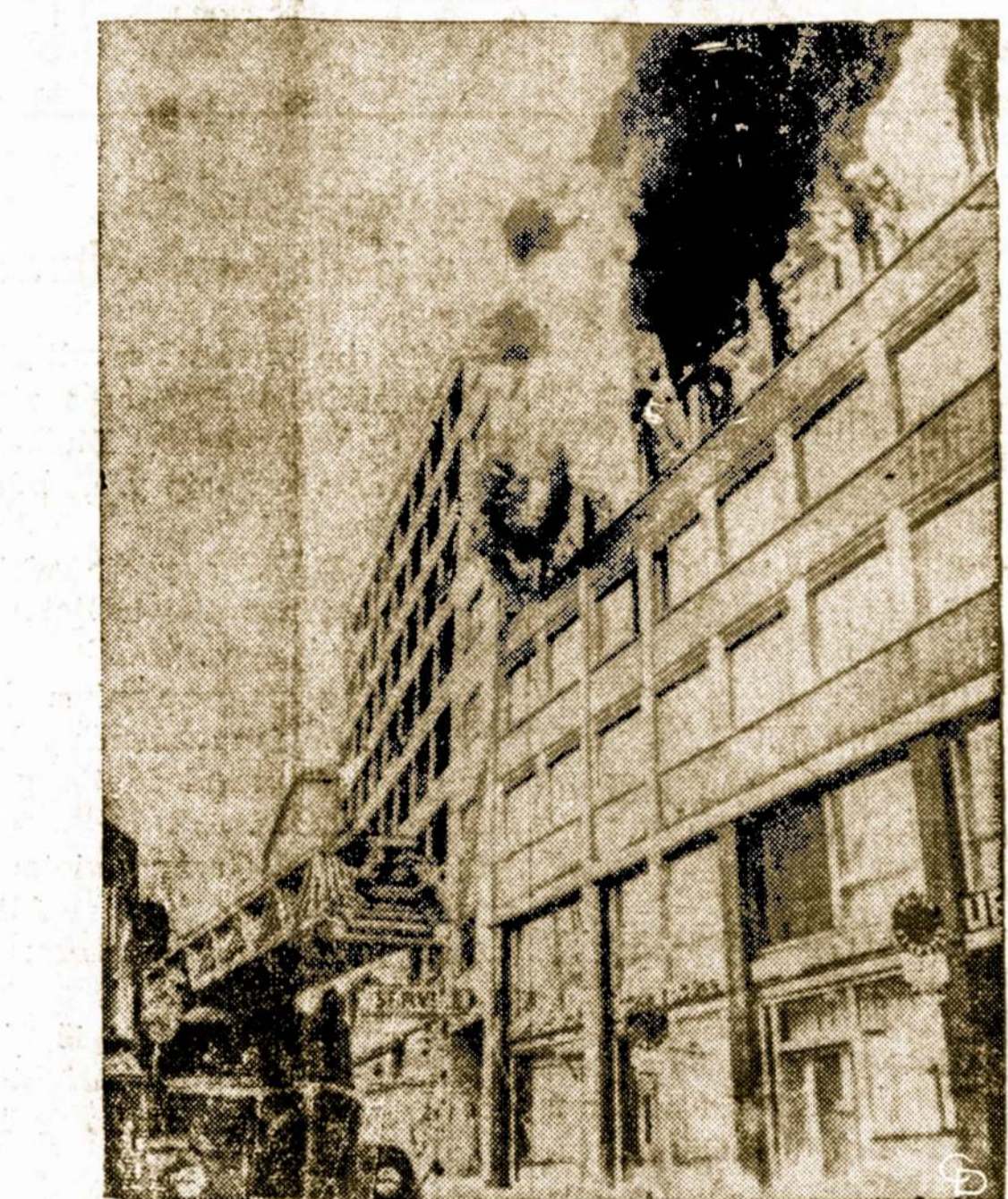
Penkerių aukštų Kanados ambasados namą Vienoje (Austrijoje) ištiko gaisras, kai vienas vengras Molotovo kokteliumi pastatą padegė. Du asmenys žuvo, 32 sužeisti.

Philadelphia, Pa. — Trylika auksinių monetų, kurios datuotos paskutinėje dienoje Romos respublikos ir Romos imperijos, buvo pavogtos šiomis dienomis iš Pensylvanijos universiteto muziejiaus.