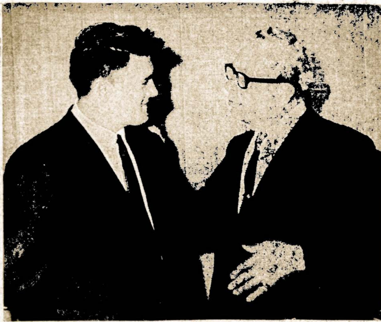
Neseniai mirė nuostabus lietuvių bičiulis, JAV žymus politikas, senatorius Everett M. Dirksen. Čia jį matome peritais metais, kalbant su Valdu Adamkum.

Jeigu jums prireikia greitai rūgštaus pieno kepinimui pyragaičių, tai reikia išlašinti į paprastą pieną keletą citrinos lašų — ir turėsite reikiamą pieną. Beraščiui ir akiniai nepada-