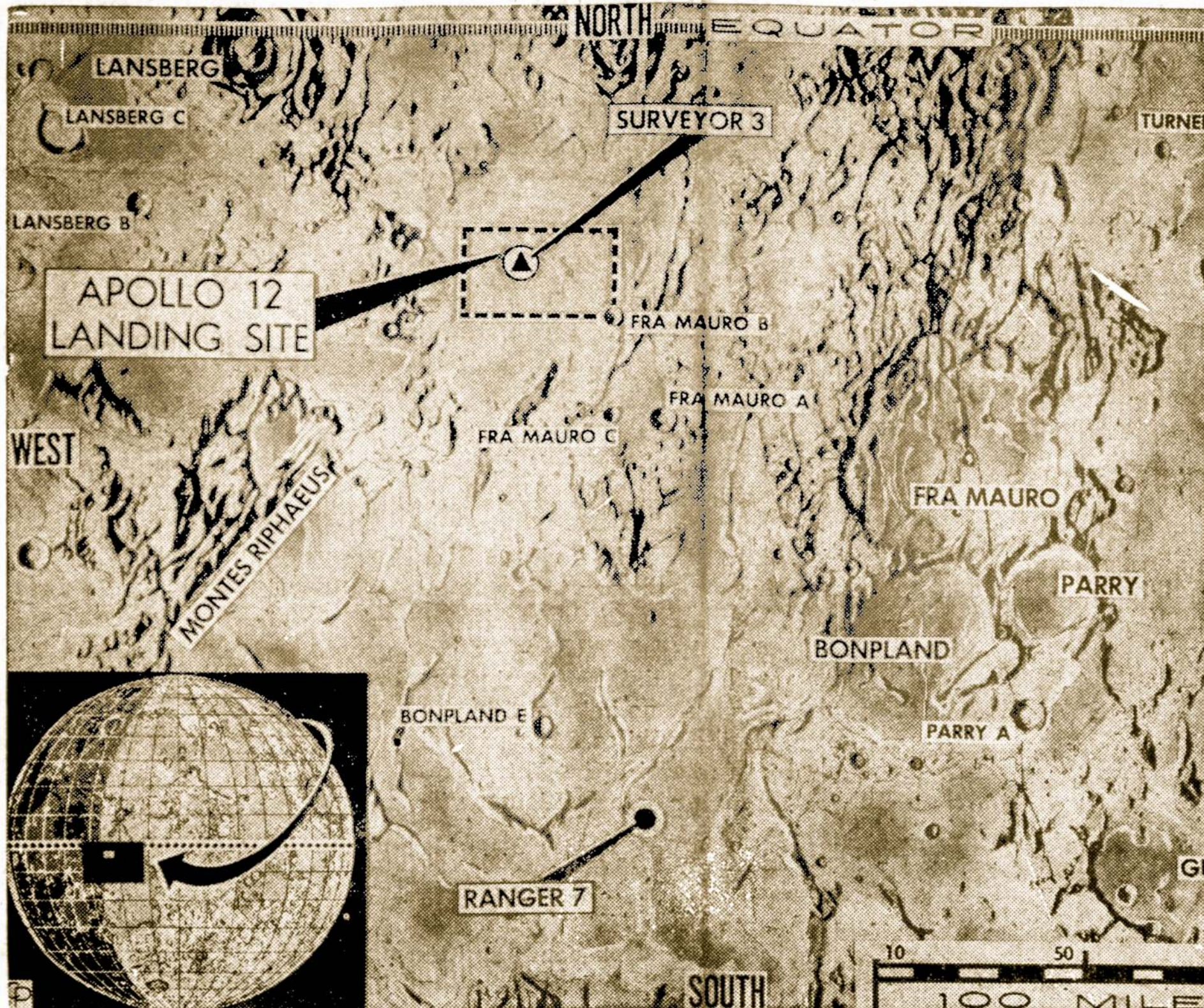
Šiame žemėlapyje pavaizduota mėnulio vieta, kur turės nusileisti Apollo 12 astronautai su prietaisu Intrepid. Keturkampyje apibrėžtame plote nusileis astronautai, gi trikampyje pažymėtame plotelyje yra Surveyor 3, išmestas 1967 m. Lakūnai išsikelia į mėnulį šiandien naktį.

Lygiai taip pat rusai apiplėšė Vilnių, Gardiną ir kitas vietoves.