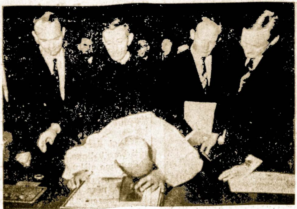
Apollo XI astronautai, lankydami įvairius kraštus, nuvyko ir į Vatikaną, kur jie buvo paties Sv. Tėvo Pauliaus VI priimti. Čia matome juos ir Sv. Tėvą, stebintį mėnulio uolienas.