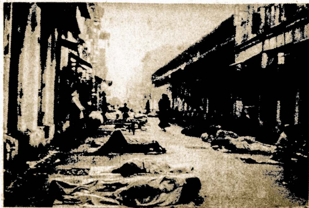
Skurdas Indijoje plečiasi. Atvaizde matome pastogės neturinčius žmones, kurie miega gatvėse. Ekonomistai sako, kad vargas gali dar padidėti.

Pastarieji išpėja žmones mesti į šalį visas piliules ir pačių pasirinktus vaistus, o vartoti