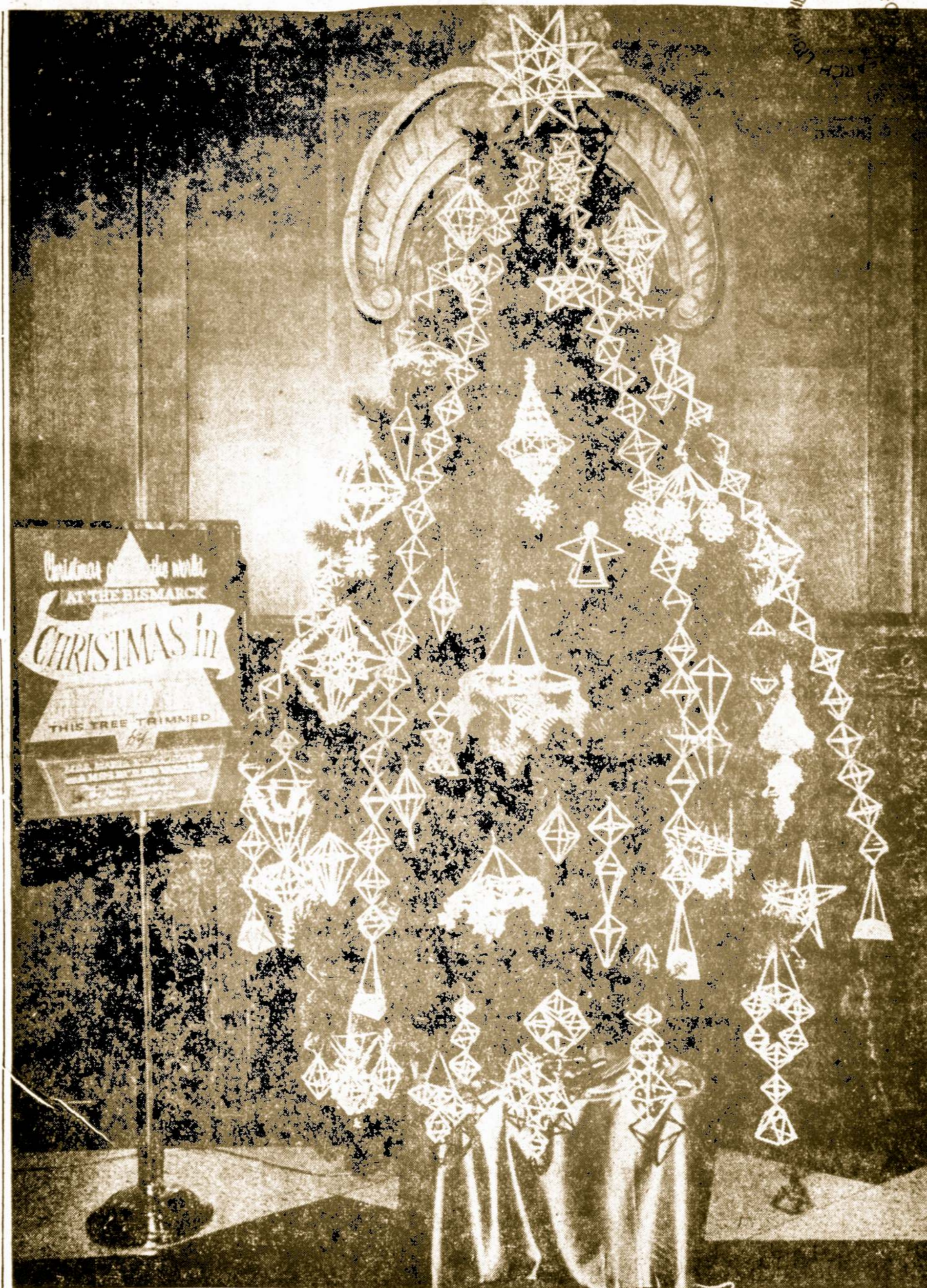
Lietuviša Kalėdų Eglutė Chicagos Bismark Viešbuty

Policija aiškina nužudymo priežastis. Nužudytojo pinigine rasta 77 dol. ir marškinių kišenėje 6 dol.