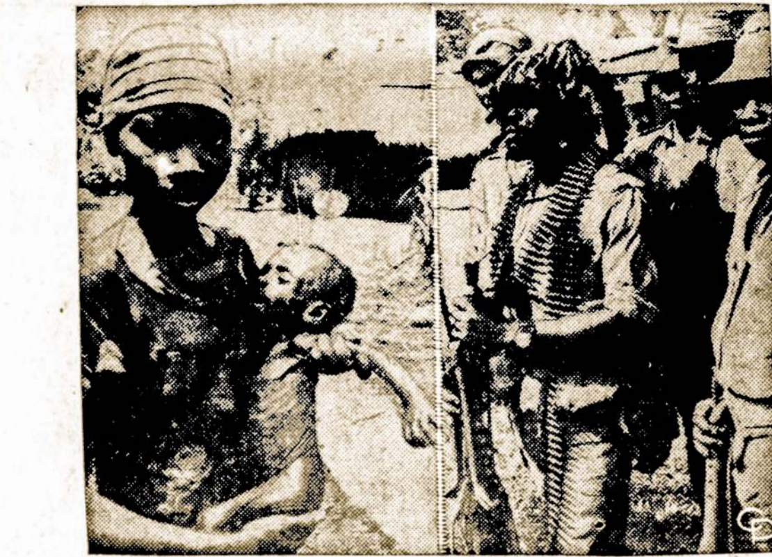
Biafra paskutinėm pasipriešinimo dienom: motina su išbadėjusiu vaiku; pralaimėję kovotojai.