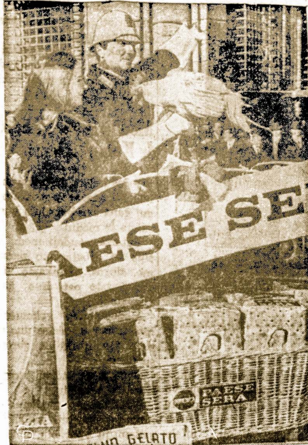
Italijoje yra mada Trijų Karalių dieną apdovanoti gatvėse susisiekimą tvarkančius policininkus. Įdomu, kur tas policininkas padės gyvą gaidį?

— Pacientas: — Ach, pone daktare, ar negalėtumėte man tą, įteikti raštiškai.