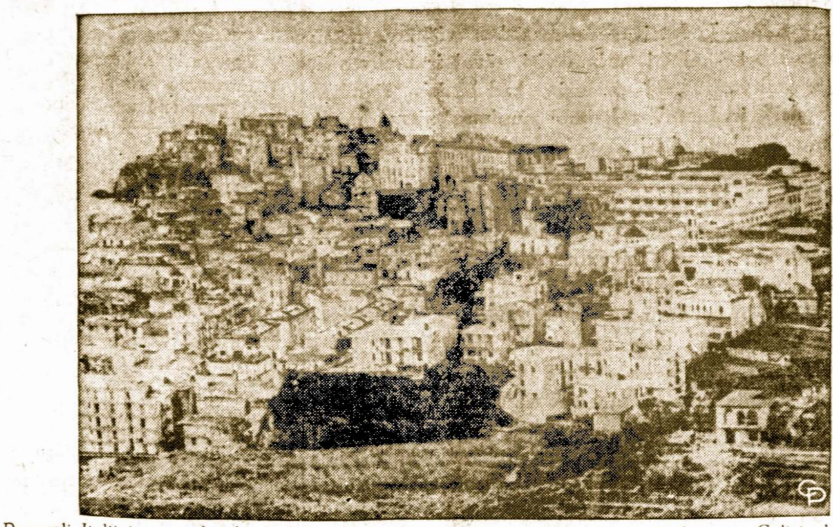
Pozzuoli, Italijoje, miesto bendras vaizdas. Miesto žemė kyla, sproginėja, žmonės išskrausto. Gali įvykt katastrofa

Tie žmogėdros į tą apylinkę atvyko iš kaimyninės Malavijos valstybės, kur taip pat grobė ir žudė vaikus sau maistui.