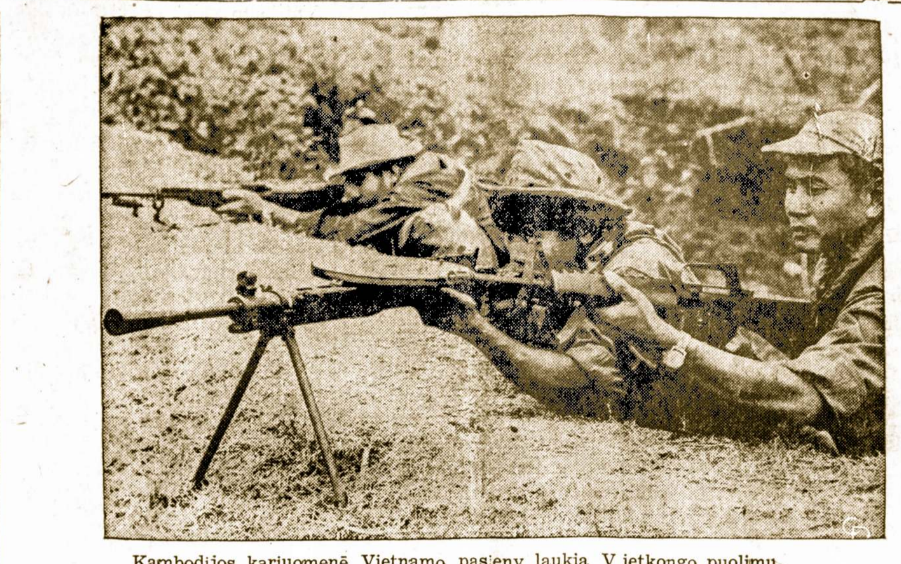
Kambodijos kariuomenė Vietnamo pasieny laukia Vjetkongų puolimų.

Kiekviena transliacija trukdanti stotis turi po kelis bokštus trukdytojus. Nemaža stočių, turinčių ligi 20 bokštų trukdytojų. Iš viso bolševikpinėse šalyse veikia daugiau kaip 2,000 bokštų trukdytojų.