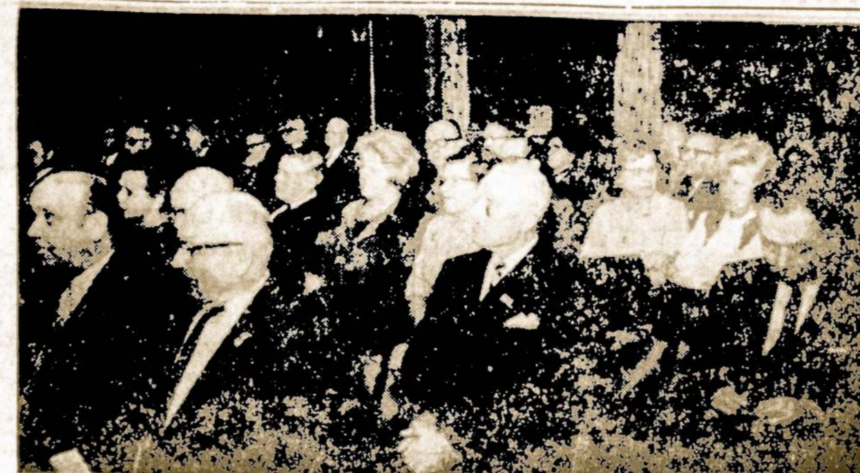
Chicago Lietuvos prekybos rūmų susirinkime.

Reikia paimti: 1 1/2 svaro keptos veršienos, 3 šaukštus sviesto ar margarino, 2 šaukštus miltų, 3 puodukus pieno. Be to, paimti: 4 "pimentos" sumalti, 1 1/2 šaukšteli druskos ir 1/4 šaukšteli pipirų. Daroma taip. Supiaustyti veršieną gabalėliais. Išleisti riebalus, supilti miltus, pripilti pieno ir gerai pavirinti iki sosas sutirštės. Tada sudėti į jį piaustytą veršieną, "pimentos" ir išmaišius viską — paduoti karštą patiekalą į stalą.