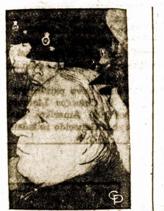
Naujasis Britanijos ministras Edward Heath apsuptas gerbėjų, po rinkimų laimėjęs.

Iš visų senovės laikais skaitomų statybos stebuklų, užsiliko tik vienos piramidės Egipte. Winthrop Rockefeller nusprendė kandidatuoti į Arkansaso gubernatorių trečiam terminui. Vakarų Vokietijos parlamentas suteikė teisę balsuoti ir, 18 metų jaunuoliams. Kalbėti mes išmokstame vaikystėje, bet tylėti mums nesiseka išmokyti, net ir senatvėje. Baltimorė, Md., miestas buvo pirmas, kuris įvedė 1816 metais namų apšvietimą gazu — dujomis. Zmogaus supratimu nėra negalimo, jeigu jam pačiam to atlikti nereikia. Pirkta duona peilio bijo.