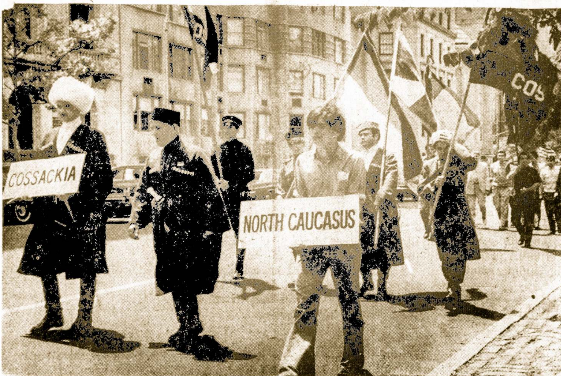
Kovoje už savo pavergtosios tėvynės laisvę nesame vieni. Drauge su mumis kovoja ir kitos komunistų pavergtos tautos. Atvaizde — kazokų ir šiaurės kaukazių atstovai su savo vėliavomis žygiuoja pavergtųjų tautų savaitės proga New Yorke

Balstogėje, į piet-vakarūs nuo Gardino, lenkų archeologai pradėjo įrengti specialų muziejų, skiriamą atvaizduoti senovės lietuvių gimines jotvingių, gyvenusių toje apylinkėje. Tą giminių