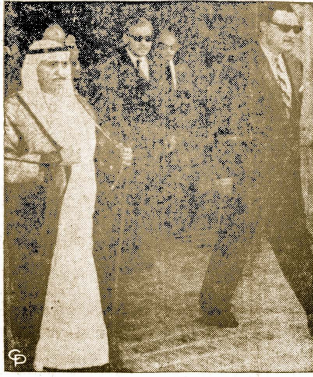
Paskutinis Nasserio susitikimas su kitų arabų šalių vadais. Po Kai ro konferencijos iš posėdžių salės išeina Nasseris (dešinėj) ir Kuwaito šeichas Salem El Sabah.

Kompartijos pareigūnams gailio ji atrodyti per daug nacionalistinė.