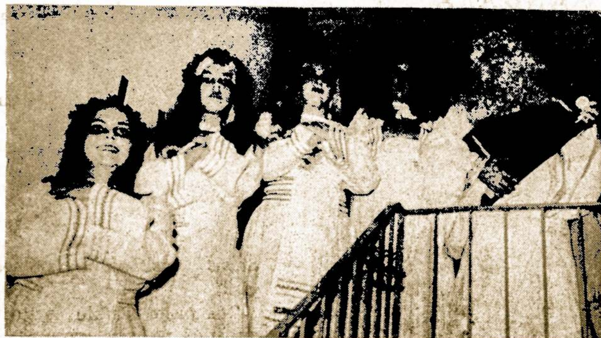
Vaidilutės ir vaidila, scena iš Alvudo vaikų teatro pastatymo lapkričio 8 d. Chicagoje, Jaunimo centre. Buvo suvaidinta A. Kairio "Du broliukai", rež. Al. Brinka.

FURNITURE CENTER, INC. MARQUETTE PARKE 6211 So. Western Ave. PProspect 8-5875 Vedėjas J. LIEPONIS Pirmad. ir ketvirtad. — nuo 9 iki 9:30 Kitom dienom — nuo 9 iki 6 val. vak. Sekmadieniais — nuo 12 iki 5 val. vak.