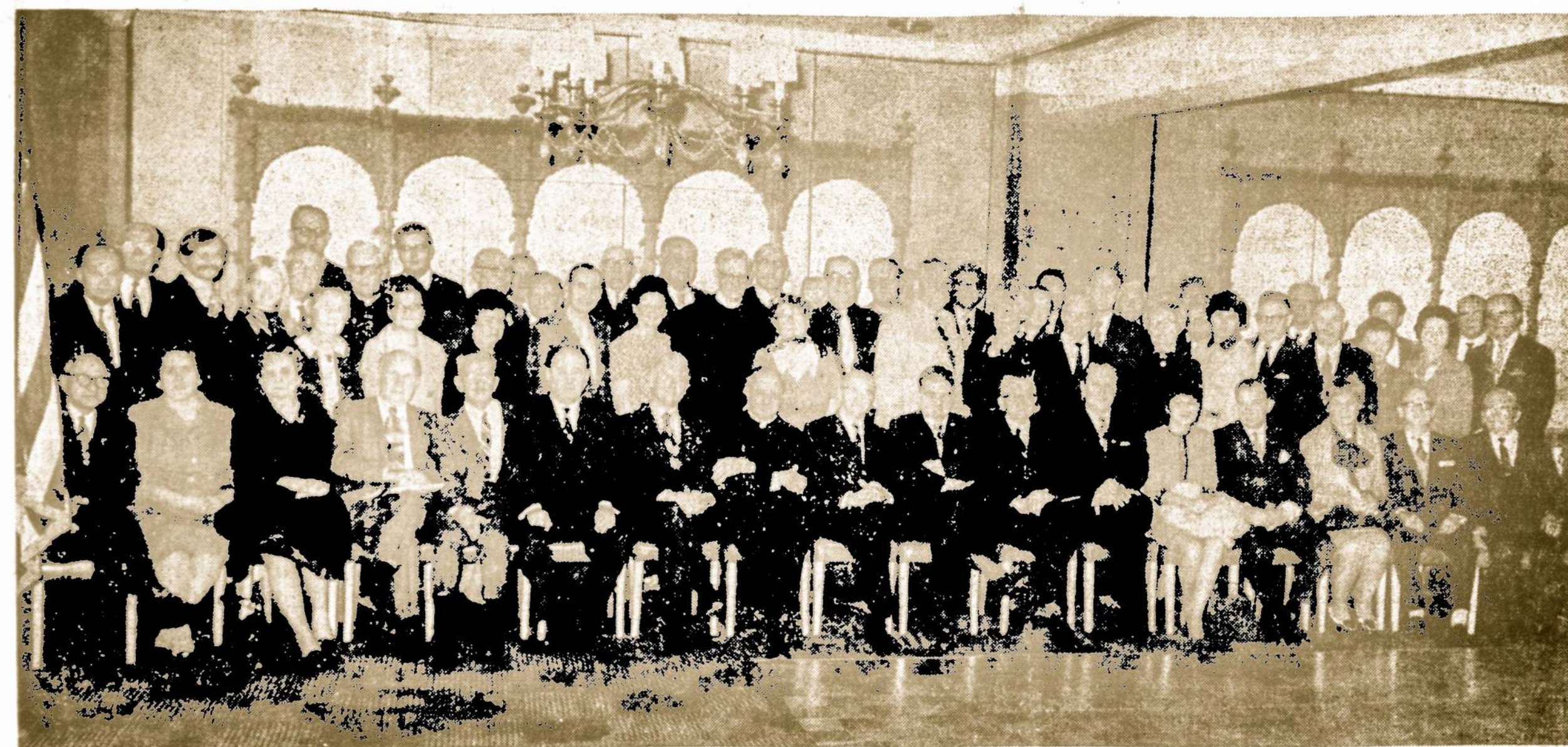
Amerikos Lietuvių Tarybos konferencijos, įvykusios Bismarck viešbutyje, Chicagoje, lapkričio mėn. 14 dieną, dalyviai.