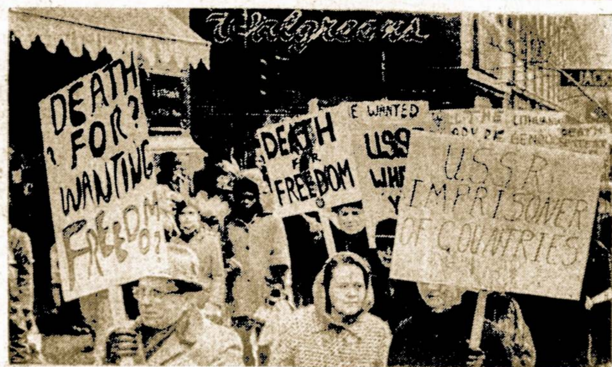
Chicagos lietuviai su plakatais demonstruoja prieš žaurias sovietų baudmes laisvės siekiantiems lietuviams

ketvertą klausiinių per savaitę, o dar geriau — vieną klausinį kas dieną.