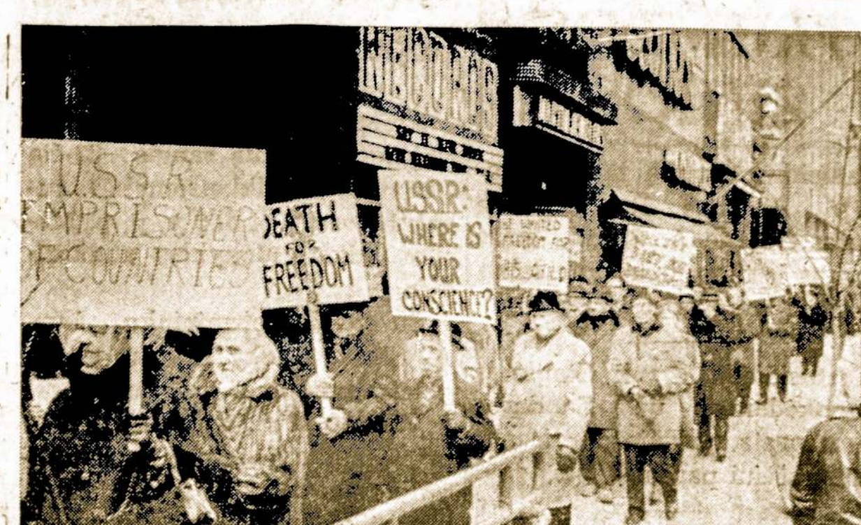
Chicago's lietuvių demonstracija prieš Sovietų priespaudą.