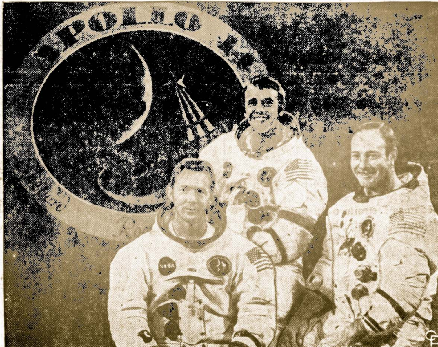
Apollo 14 astronautai Stuart Roosa, Alan Shepard ir Edgar Mitchell, šiuo metu baigia pasiekti mėnulį.

Jaustis laimingu, kad ir esant be ypatingų išteklių ar pragangškų gyvenimo aplinkybių, tai reiškia patirti tikrąją laimės vertę.