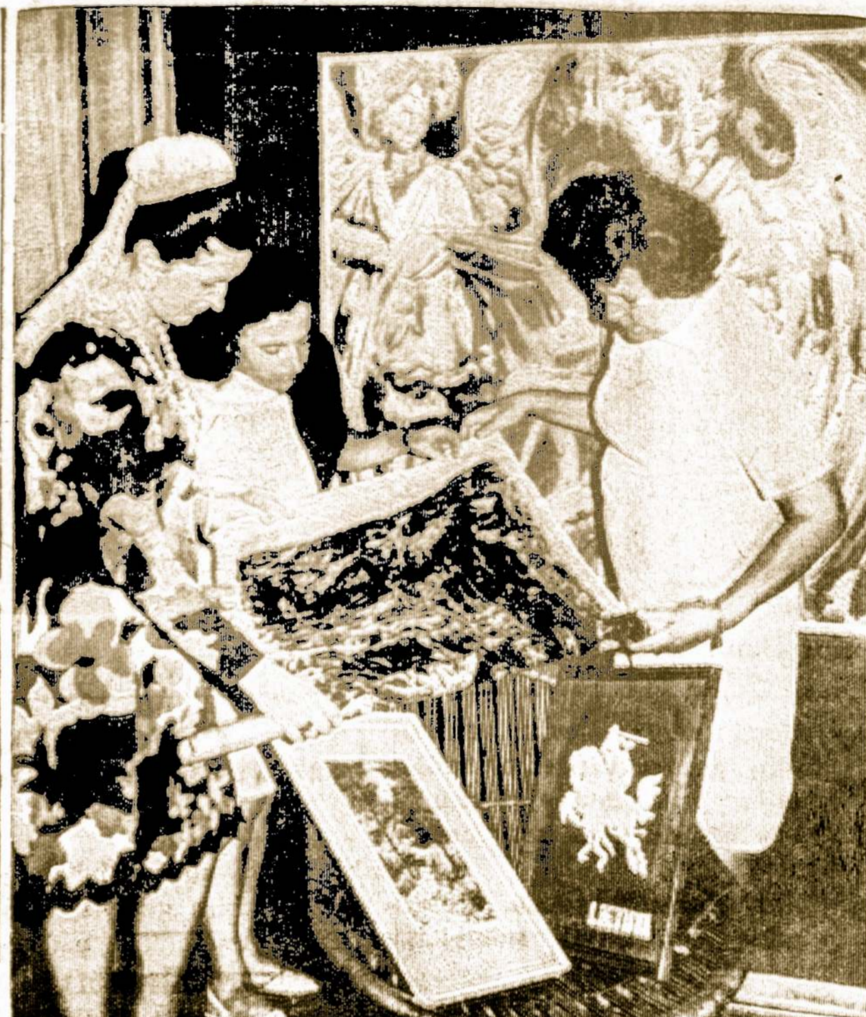
Šių metų liepos 18 dieną, sekmadienį, 3 val. po pietų, Indianoje bus dedikuotas Lituanicos paminklas, Beverly Shores Lituanicos Parke.

Teisėjo sprendime sakoma: "Palieku motinai ir dukteriai teisę apsispręsti pagal jų sąžinę ir įsitikinimus. Nesipriešinsiu prieš jų valią, kai mergaitė nebėra vaikas, o motina kartu su dukterimi po ilgo ir giliaus svarstymo priėjo tokios išvados."