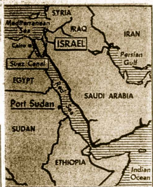
Artimųjų Rytų valstybės, į kurias savo kojas kelia Sovietų Sąjunga.

Tai pirma moteris tokiose aukštose pareigose Vatikanu.