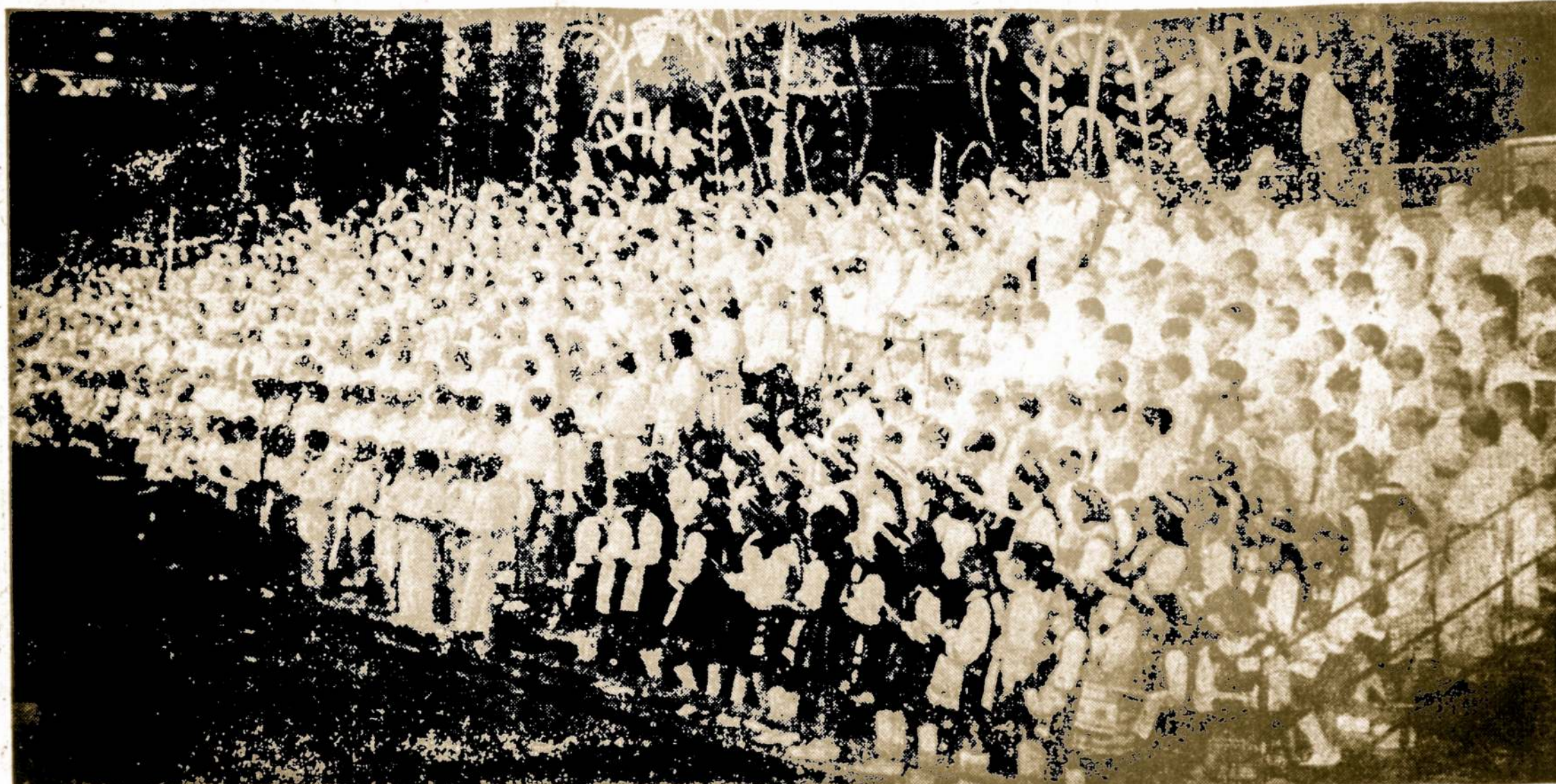
Ar galėjo būti kas gražesnio, kai tūkstantis mūsų mielojo jaunimo choras, suvažiavęs iš visos Amerikos ir Kanados, sutartinai užtraukė: "Mūsų žemė Lietuva". Vaizdas iš IV Dainų šventės Chicagoje, 1971 liepos 4.

Buv. Michigano gubern. George Romney yra vienas svarbiųjų mormonų ir jis dabar tur- vargo išaiškinti tokį savo sek- tos nusistatymą.