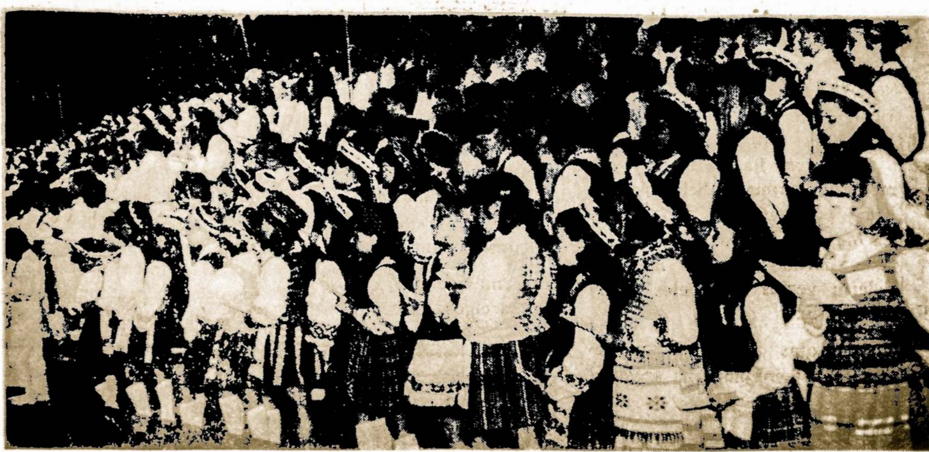
IV-sios Dainų Šventės choristų dalis

Medauninkus darvti atsargiai, sudėti į taukais išteptą paigą