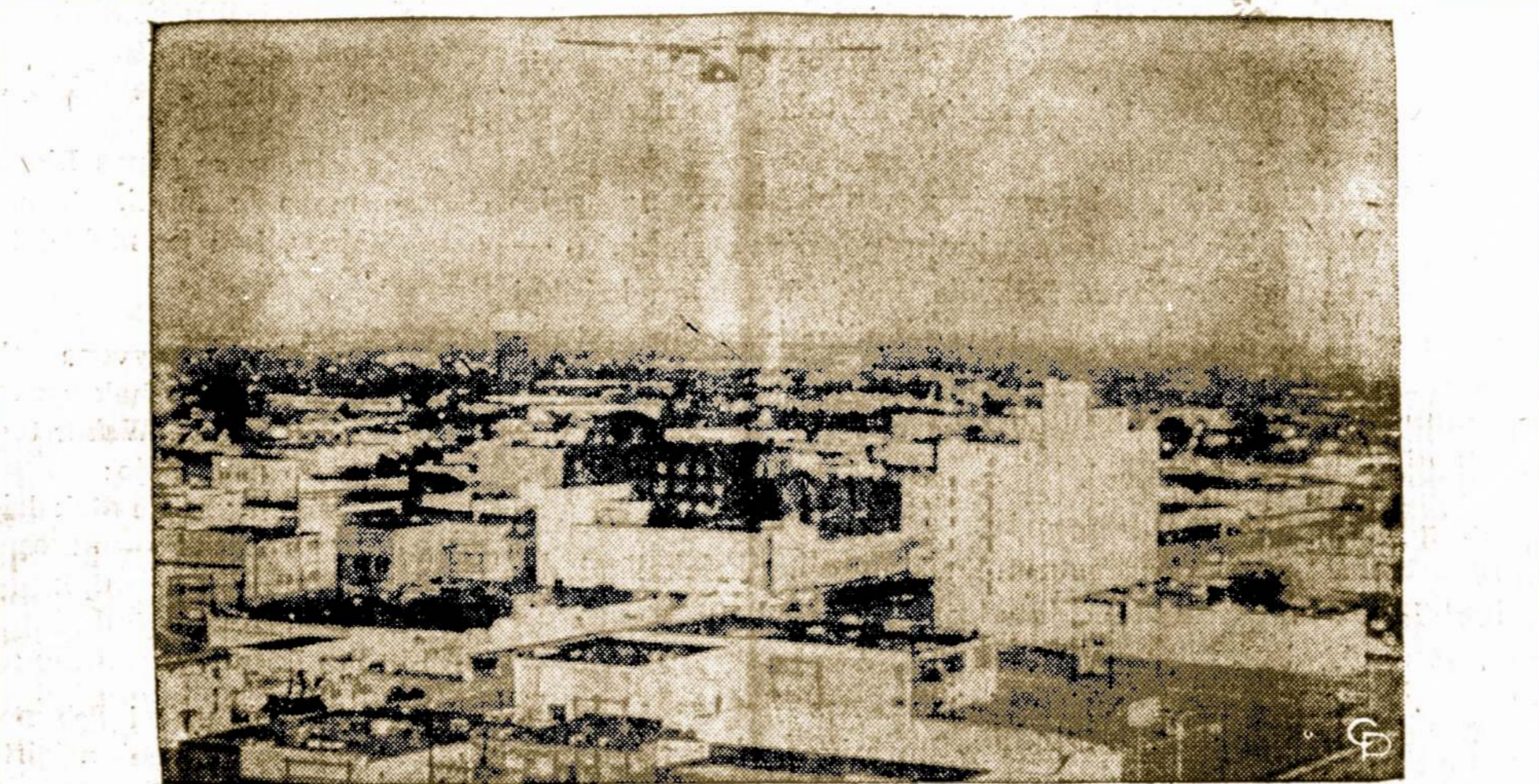
Virš Brownsville, Tex., lėktuvai purškia dūmus, kad sunaikintų uodus, kurie platina ligas, nuo kurių serga arkliai ir pradeda sirgti žmonės. Liga atėjo iš Pietų Amerikos per Centrinę Ameriką ir Meksiką į Texas. Valstijoj uždėtas arkliais karantinas.

Paskirti bendriems reikalams, ne rytoj, ne savaitės, bet dabar.