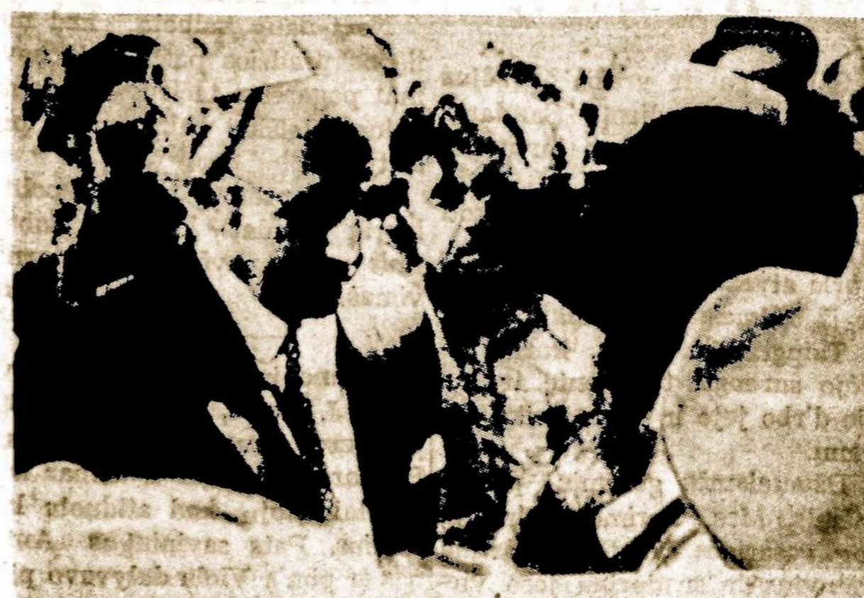
Vakarų Vokietijos užsienio reikalų ministeris Walter Scheel buvo į Izraelį nuvykęs. Čia matome jį kalbant su burmistru Teddy Kollek ir vienu rabinu.