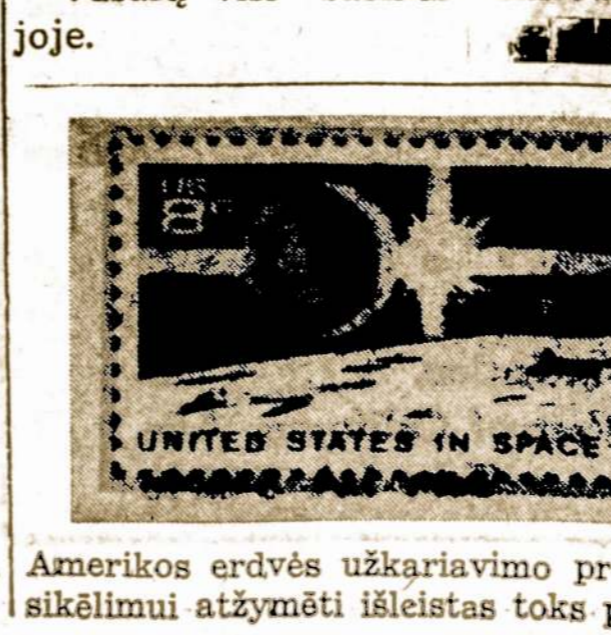
Amerikos erdvės užkariavimo programos dešimtmėčiui paminėti ir išsikelimui atžymėti išleistas toks pašto ženklas.