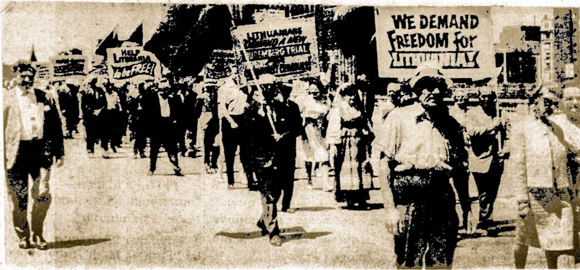
Pavergtųjų tautų savaitės proga VII. 17 Chicagoje įvyko didžiulė pavergtųjų tautų demonstracija. Čia matome dalį žygiuojančių lietuvių.

Kas yra našlys? Tai yra toks vyriškis, kuris buvo nuteistas ir atsėdėjo savo bausmę.