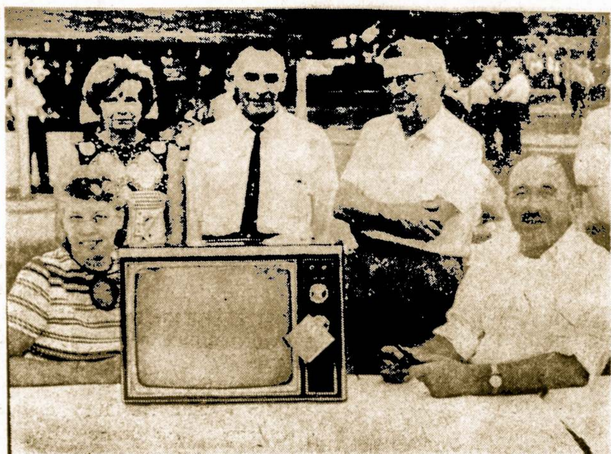
SANDAROS PIKNIKO TV LAIMETOJAS

Dar ilgokai linksminosi vasa- ros šventės dalyviai ir tik gero- kai sutemus, patenkinti traukė daľnuodami namolej... p. petitas