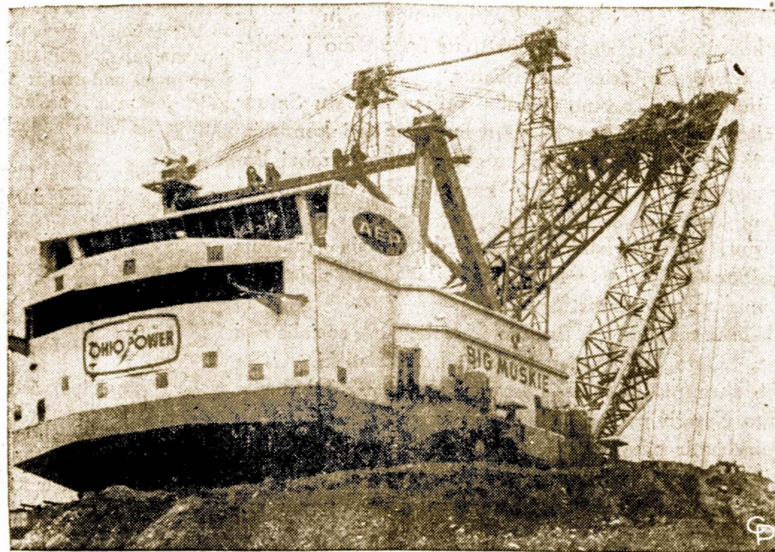
Didžiausia pasaulyje žemės kasimo mašina, naudojama kasyklose netoli Zanesville, Ohio.

Kyla klausimas, kodėl jis taip veidmainiauvo? Nesunku atspėti. Kaltinamasis N. buvo žymus partietis ir jį užkabiintii ministerijos pareigūnų tarpe — yra pavinga.