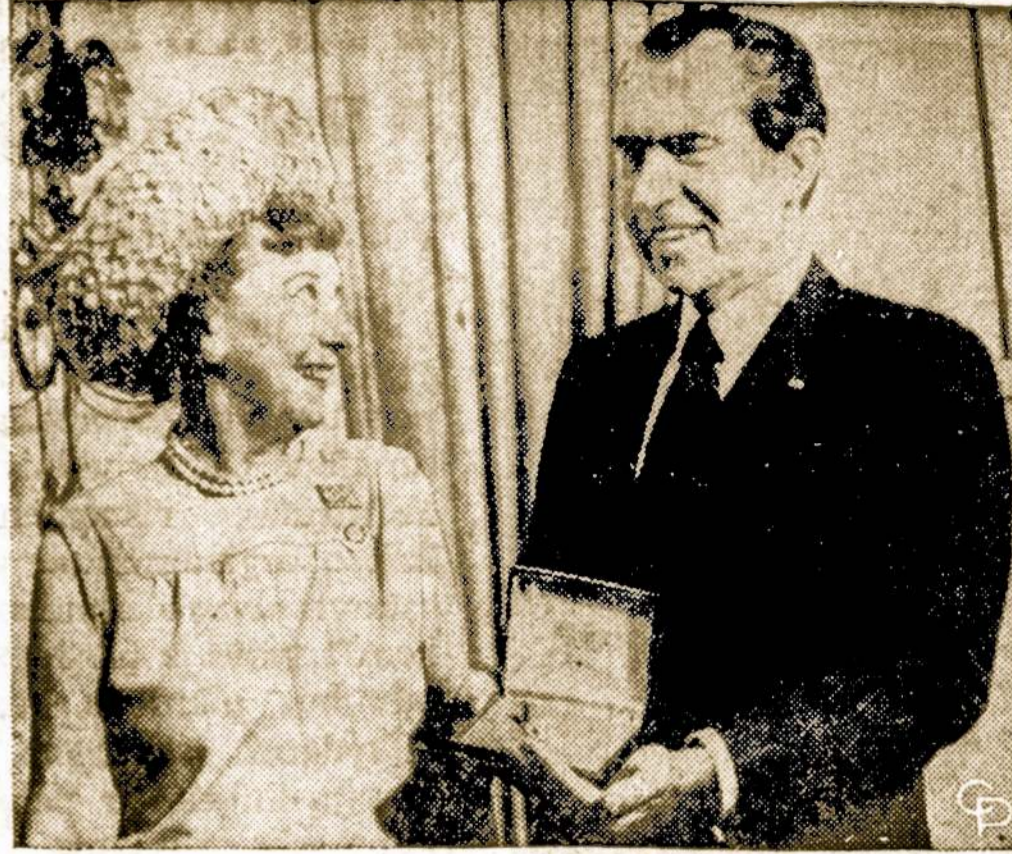
Prez. Nixonas įteikia pirmąjį 1 dol. monetą, su buv. prez. Eisenhower paveikslu velionies žmonai.