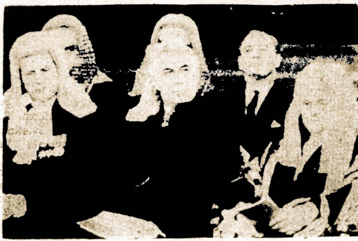
Aukščiausiojo teismo pirmininkas Warren Burger lankosi Britanijoje ir posėdžiauja su kolegomis anglais Westminsteryje.

Kitos, irgi gana svarbios priemonės, yra vengti įvairių