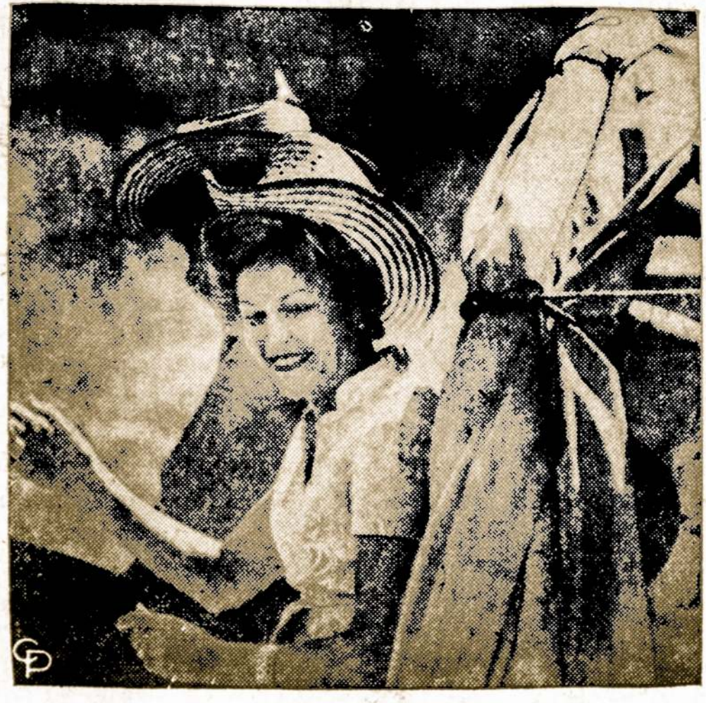
Mrs. Nixon, atidarydama naują valstijos parką, važiuoja senuoju pašto vežimu Medford, Oregon.

Seimyninė laimė glūdi ne vien gražiose žodžiuose, šypsensose ir jautrumo. Žmona paprastai iš vyro išgirsta nedaug švelnių posakių ir komplimentų. Bet protingos žmonos dėl to nenusimena, nes ne žodžiais sudaro šeimos laimės pagrindą. Klaidą daro tos žmonos, kuriuos vyrams pavydi jų palinkimus. Vyras, pavyzdžiui, laisvalaikiu mėgsta su bičiuliais paloti kortomis, skaityti, išvykti į golfo lauką, išvažiuoti žuvaui. Savimeilės moterys dėl to ir pačios kenčia ir vyrams išmetinėja: girdi, vyras suranda dalyką (kuris jam yra malonesnis ir brangesnis, negu buvimas namuose. Irotingosios ir jautrios žmonos tokius savųjų vyrų palinkimus didelio dėmesio nekreipia. Jos netgi skatina vyrus tin-