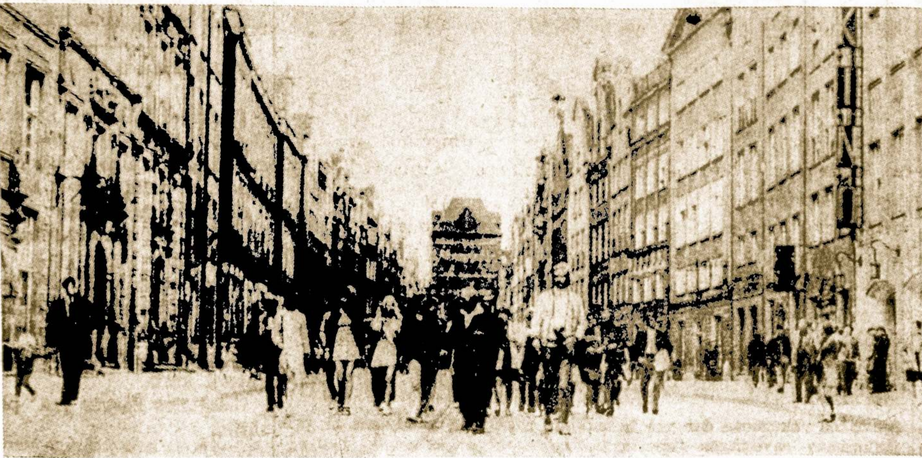
Senasis Gdanko (Danzig) miestas karo metu buvo labai sugriautas, bet lenkai jį atstatė taip, kaip jis atrodė prieš karą. Čia matome turistų labai mėgiamą sepmiesčio kampelį.

Luižė savo grožiu ar ašarom. Žinomas yra komplimentas, kurį Luižė per susitikimą Napoleonui p reišė: "Jūs esate džentelmenas!" — Napoleonas arogantiškai atsovęs jai: "Ar jūs galvojote, kad aš atrodau, kaip velnias?"