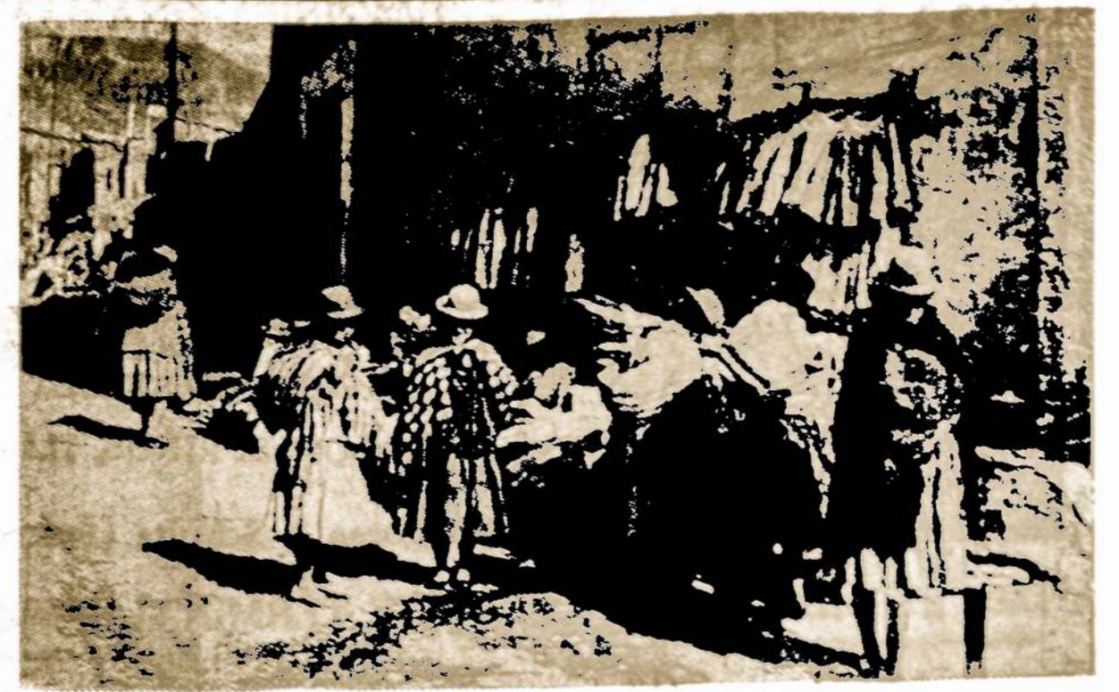
Tipingas Bolivijos miestelio vaizdas