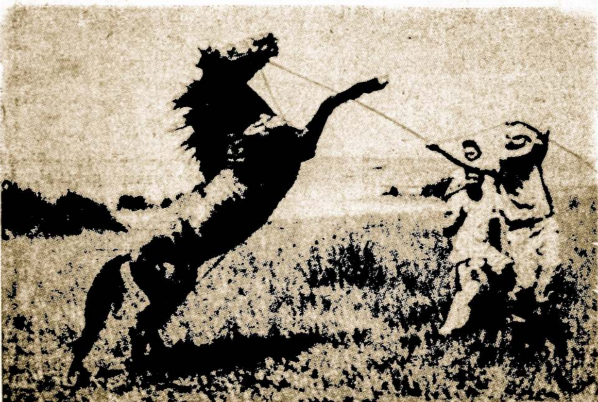
Amerikos vakaruose dar yra ir laukinių arklių. Jų gaudymas ir prijaukinimas pavojingas "sportas".

Seniausiais laikais toks nuleidimas buvo vertojamas kur kas dažniau, bet kitokių ligų atveju, tas padarydavo daug blogo, ne-