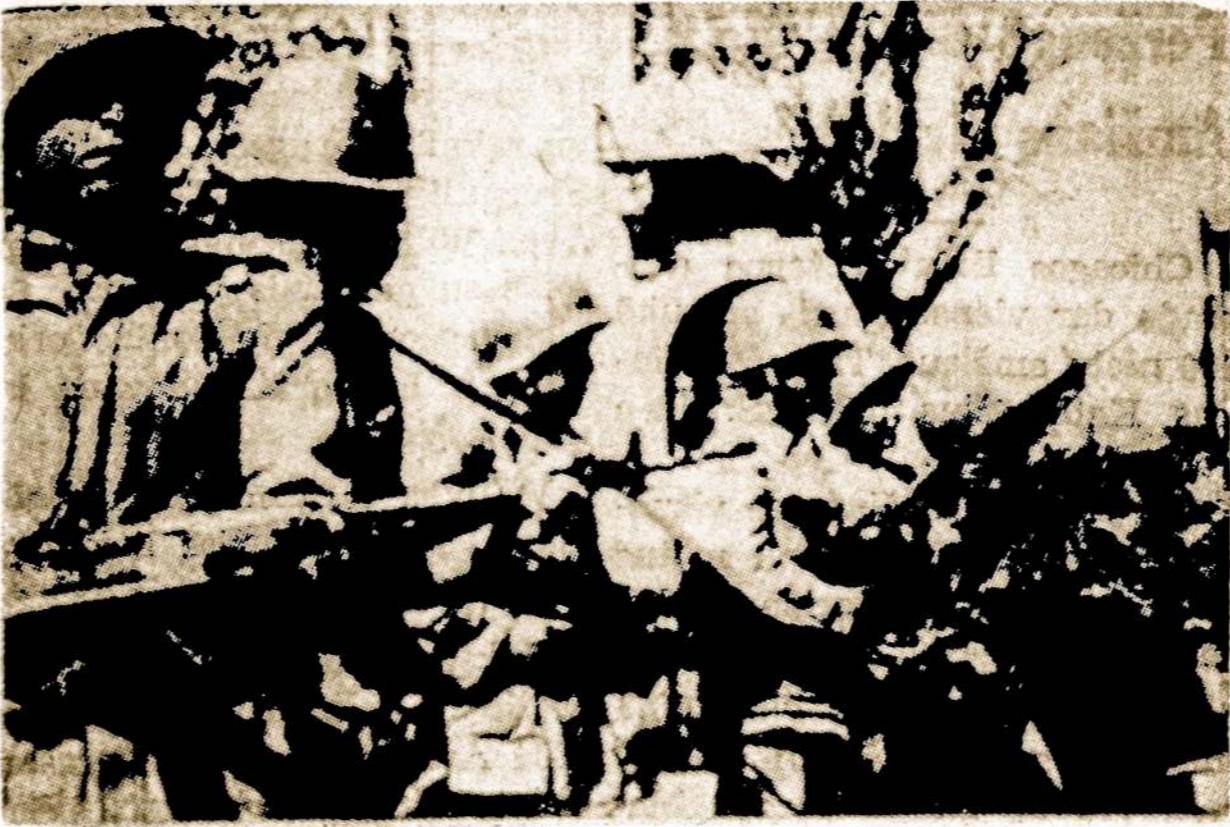
Po perversmo Bolivijoje kariuomenė tvirtai laiko valdžios vairą savo rankose