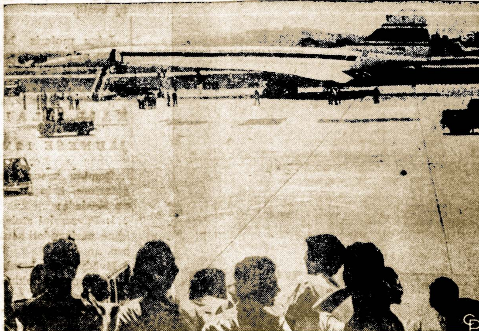
Rio de Janeiro gyventojai iš tolo stebi pirmą prancūzų už garsą greitesnį lėktuvą Concorde, atskridusį į Braziliją.