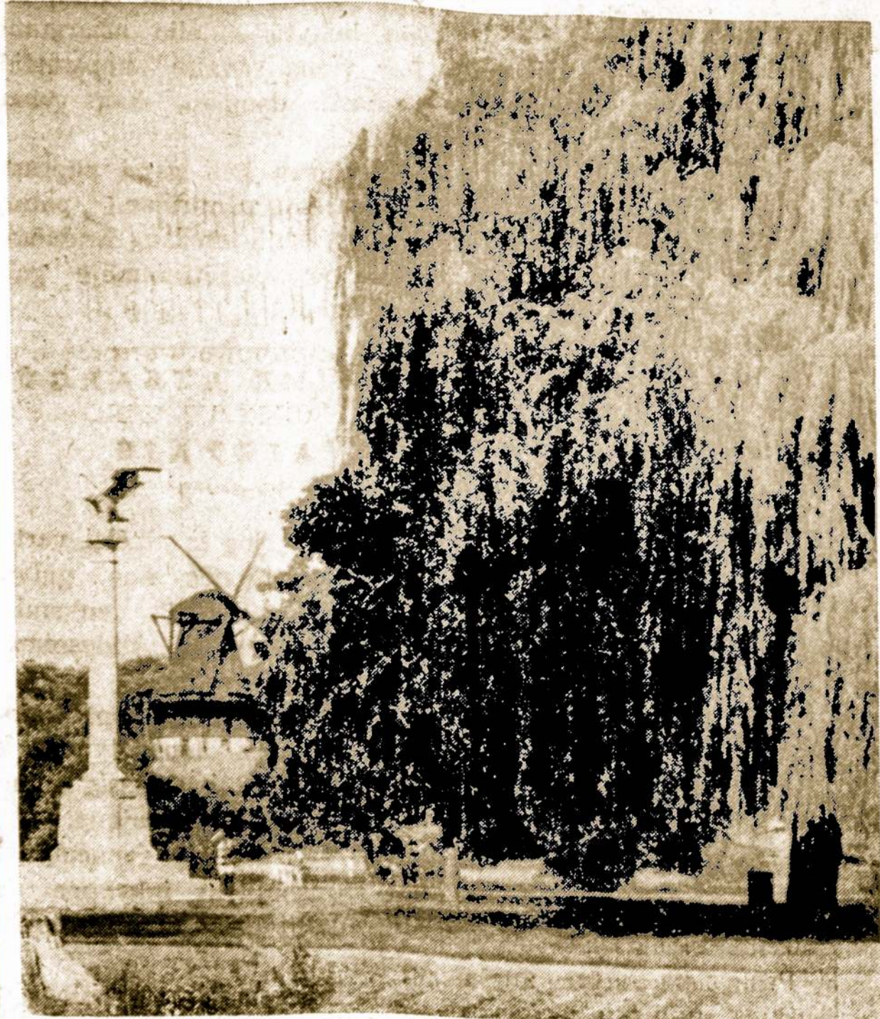
St. Charles, Ill., apylinkėse gyvena nemaža lietuvių šeimų. Viena jų turi vėjinį malūną.

1954 m. Karaliaučiuje iš viso tebuvę likę 24 vietiniai gyventojai.