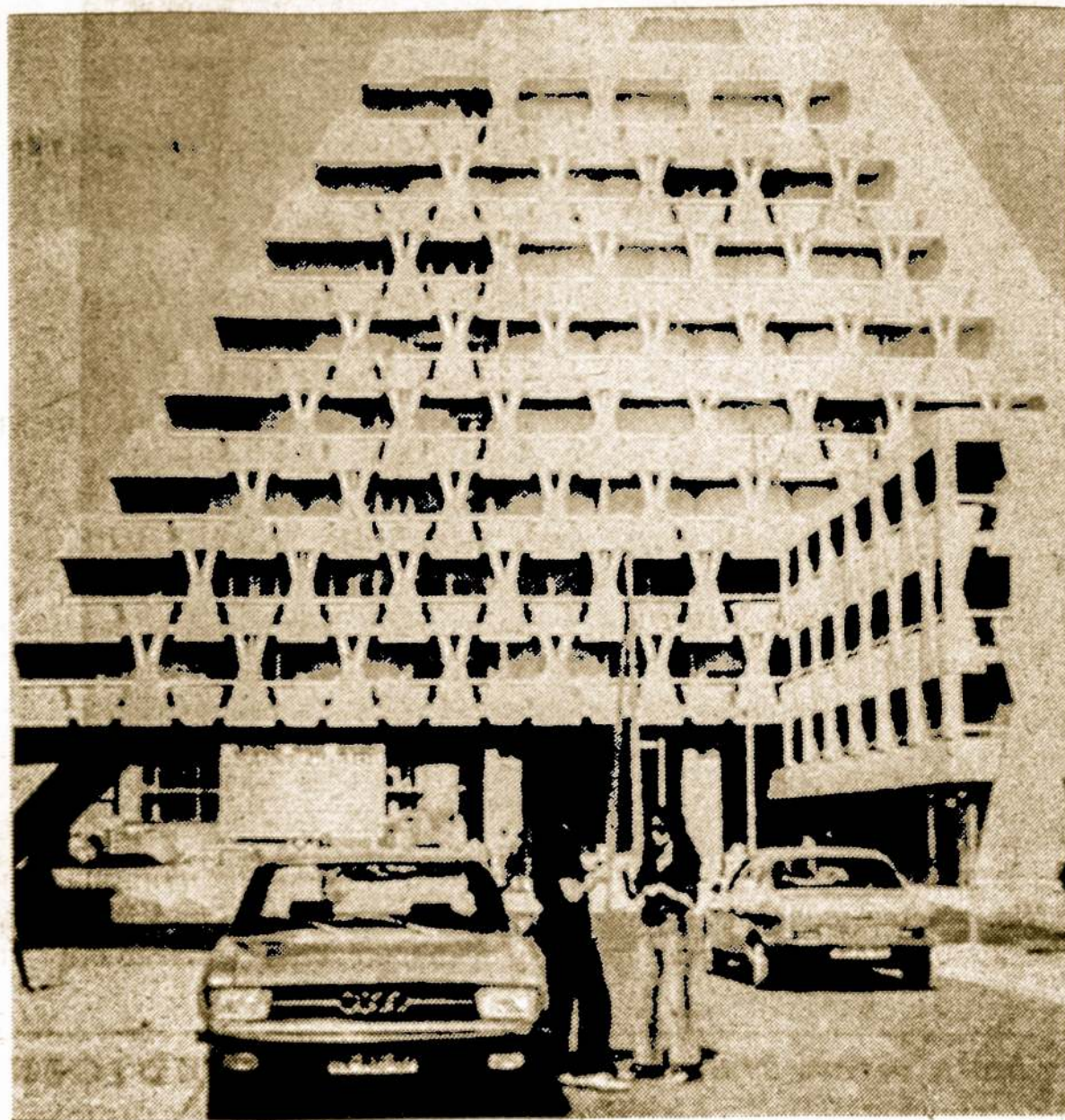
Naujo tipo daugiabučiai namai pradėti statyti Prancūzijos miestuose

Užmario (Kuršių Neringos) Bal-vietiniai juos užtat išgriau-tijos ir Šiaurės Jūrų pakraščiais, kartais pašleidžia net per At-lantą.