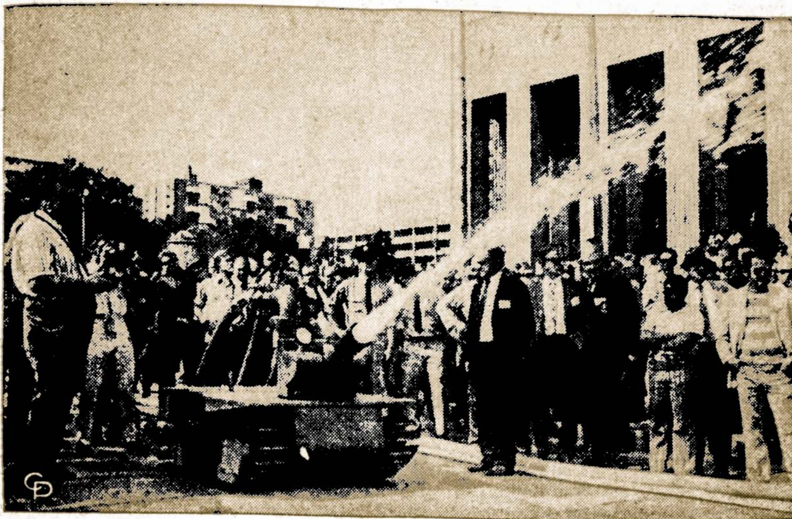
"The Firecat", į tanką panašus vežimėlis, skirtas gaisrams gesinti. Jis vairuojamas iš tolo radijo bangomis ir galės priartėti ten, kur normaliai žmogus negali. Pirmą kartą pademonstruotas gaisrininkų viršinių suvažiavime, St. Louis.

Akmenys, šliauždami pro vamzdelius, sukelia kartais lengvesnius, o kartais labai aštrius skausmus arba atakas.