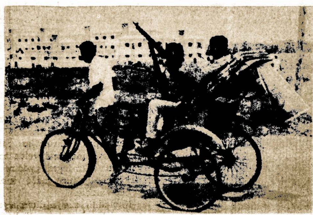
Po nepavykusių laisvės pastangų vakariniai pakistaniečiai užimame krašte įvedė griežtą karinį režimą. Tačiau kai kuriose krašto vietose Rytų Pakistano tragedija yra viena iš didžiausių šiame šimtetyje.

Naudojimas per daug gyvulinų patiekalų, kurie gamina pervirši bakterijų viduriuose, jų nuodai ir nuodai nuo gedimo, rūgimo ir pūvimo paties maisto sužaloja ir nelaiku visą virškinimo aparatą nudėvi.