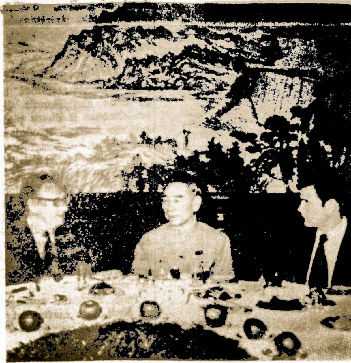
Prezidento patarėjas Kissingeris ir jo palydovas pas Ču En-lai