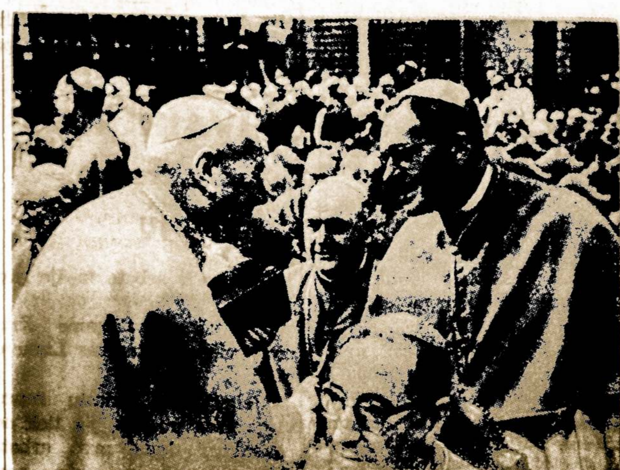
Dviejų iškilių R. katalikų Bažnyčios asmenybių susitikimas Romoje. Lenkijos primas kardinolas Steponas Wyszyński (kairėje) sveikinasi su Muencheno arkivyskupu kardinolu Doefner