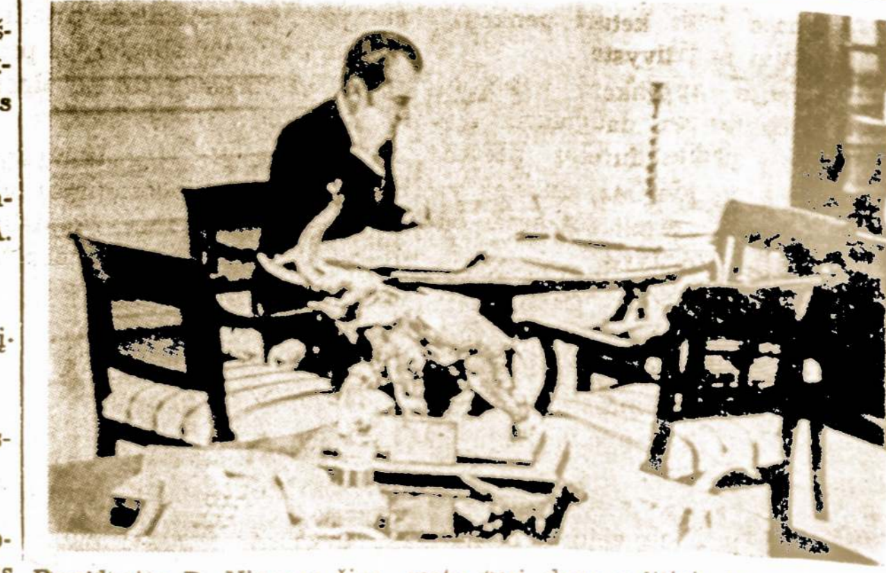
Prezidentas R. Nixonas šiuo metu turi daug politinių ir ekonominių problemų. Čia matome jį darbe metu savo kabinete.