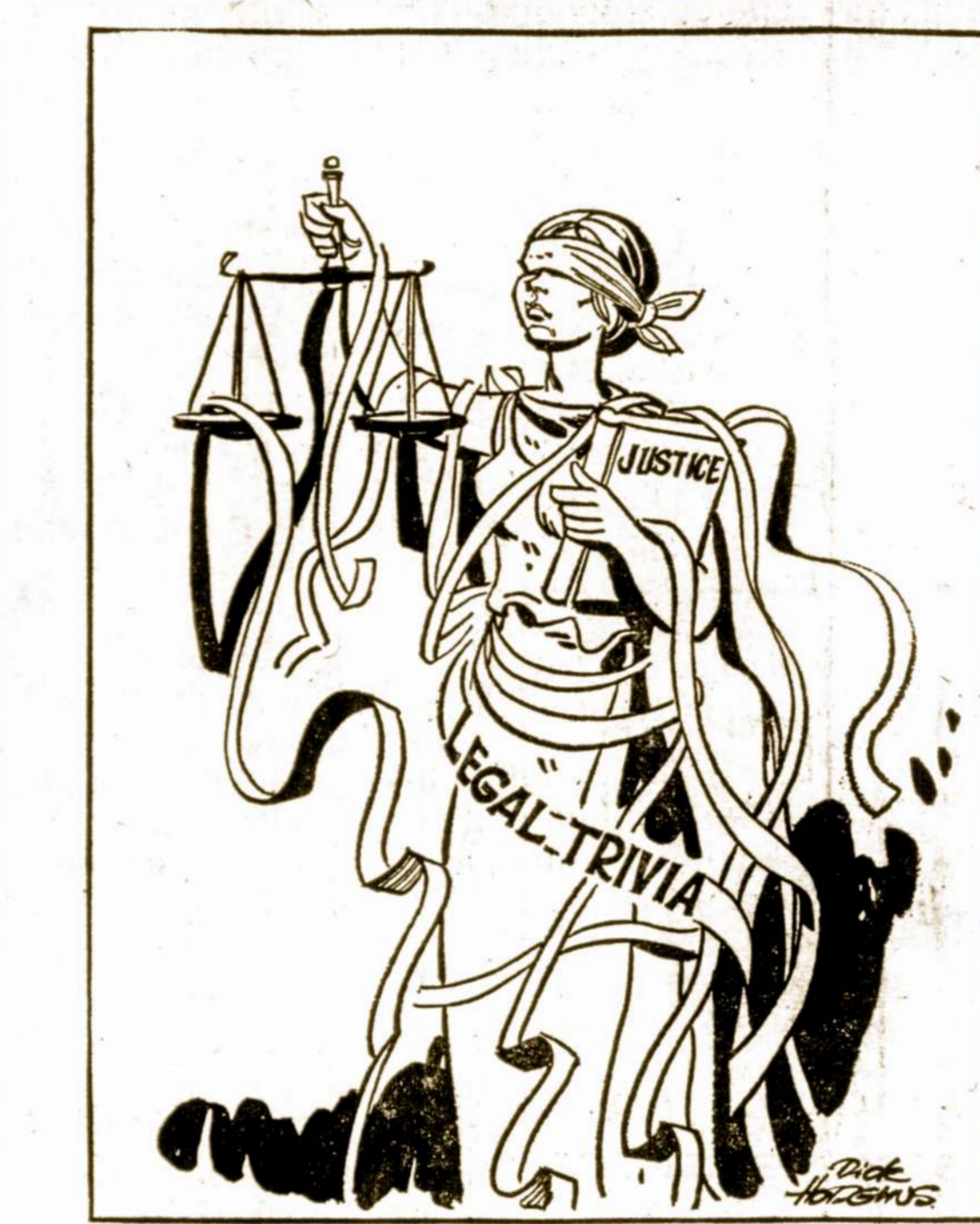
Tiesa šiais laikais tebėra užrištomis akimis.

Satelito įrenginiai veikia gerai ir tikimasi, kad veiks dar keletą mėnesių. "Mariner" apskrieja Marsą aukštumoje 863-11135 mylių per dvyliką valandų.