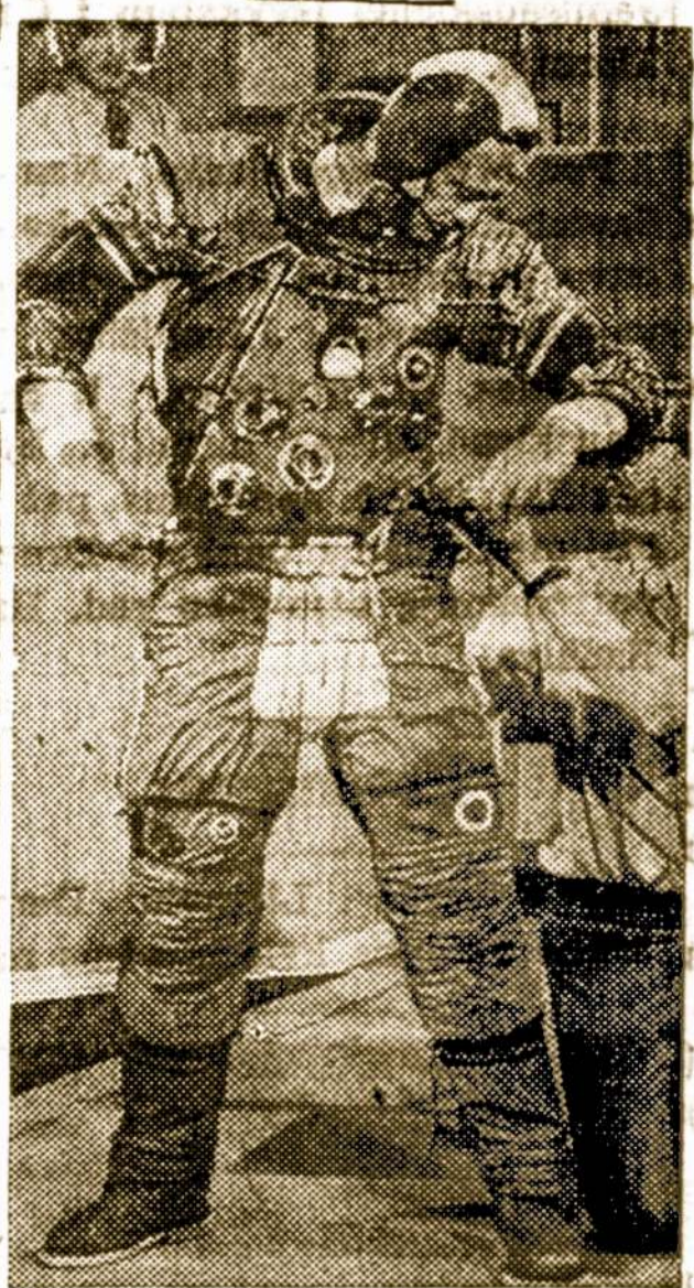
Apollo 16 astronautas maj. Charles Duke bando savo erdvių apsiaustą, norėdamas patirti kiek jis yra laisvas ir kaip jį apsirengęs gali judėti.