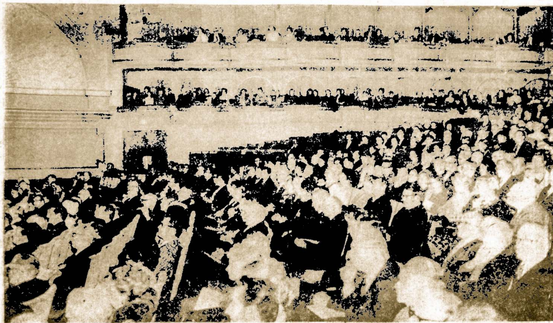
Svečiai Vasario 16-sios minėjime Chicagoje Auditorium teatre.