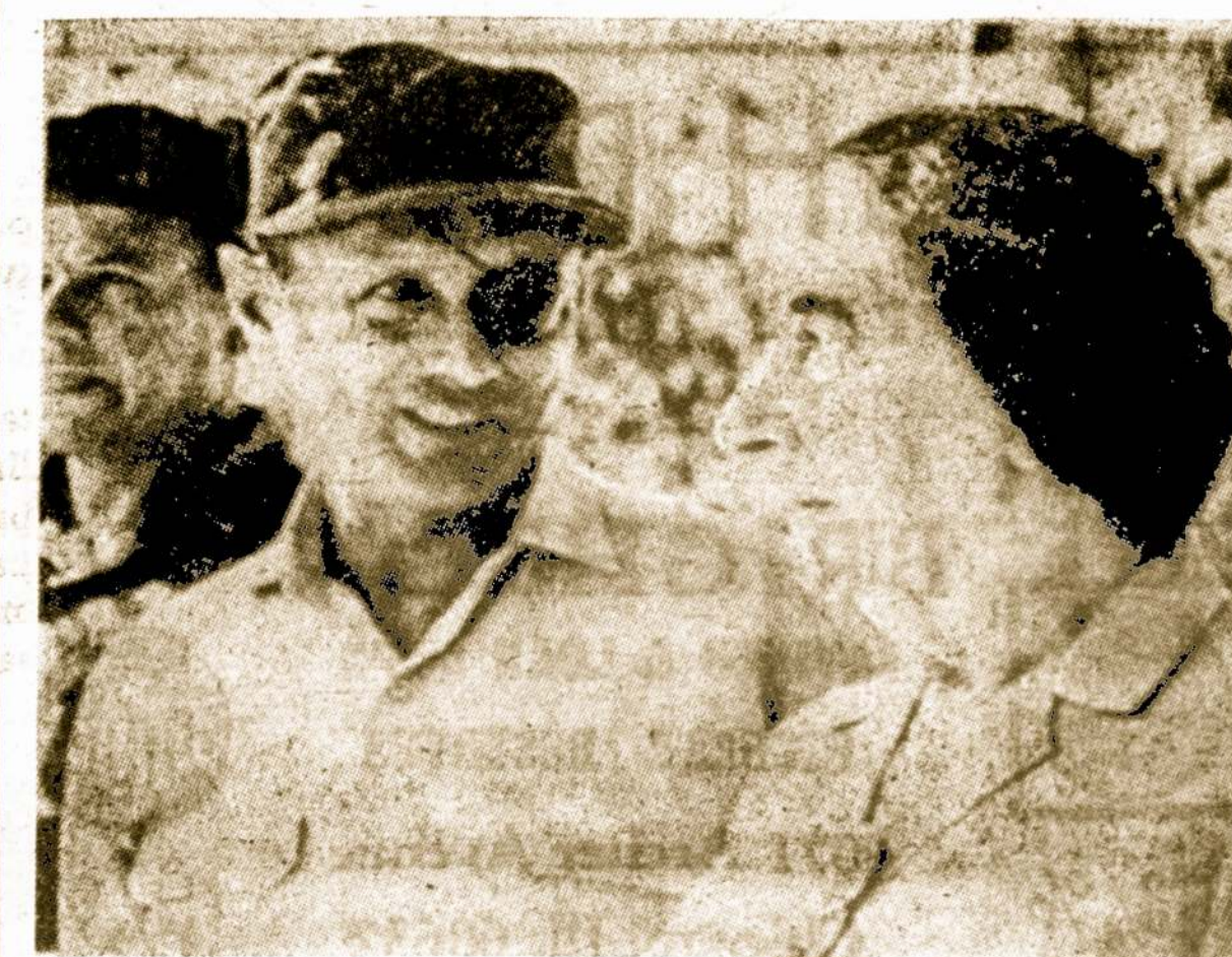
Israelio kariuomenės vadas Moze Dajanas ir ministrė pirmininkė Golda Meir viltinai žiūri į ateitį ir teigia, kad tarp savęs nesutinkančios arabų šalys nebeįstengs palausti Izraelio.

Vasario mėnesį Chicagoje buvo 153,000 bedarbiai, o visoje Illinois valstijoje — 264,000: didžiausias bedarbių skaičius per visą dešimtmetį. Bedarbių padidėjo dėl atleidinėjimų iš darbovietų, dėl grįžtančių karių iš Vietnamo, dėl pagausėjančių moterų, ieškančių tarnybų.