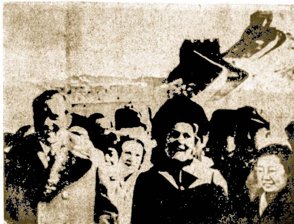
Prezidentas R. Nixonas su žmona kelionės į komunistinę Kiniją metu aplankė garsiąją Kinų sieną.

Ji pasakoja, kad Chou En-lai gerai kalbąs angliškai. Jis net daug kartų pataisė savo vertėją, kuri suklydavo.