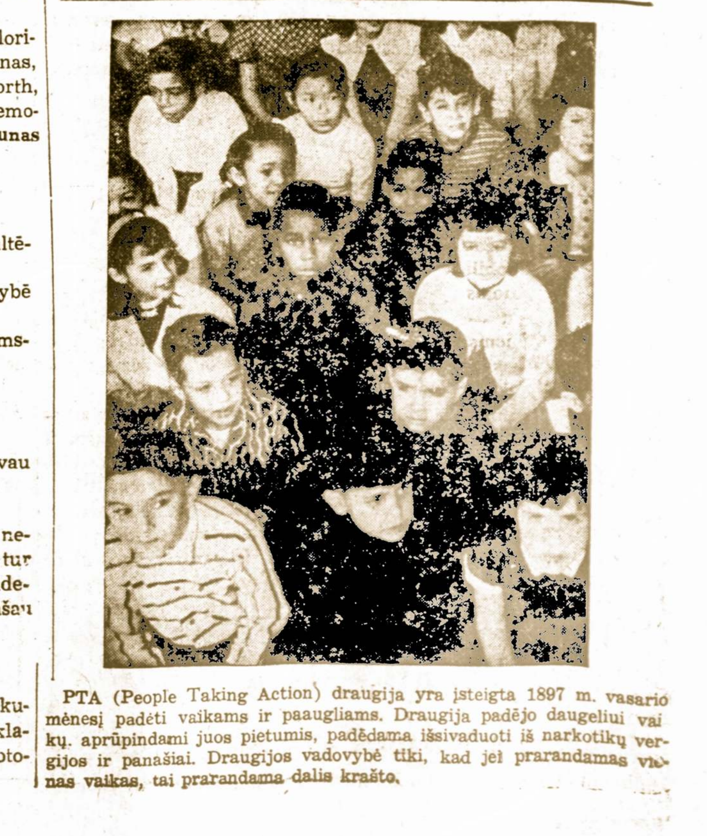
PTA (People Taking Action) draugija yra įsteigta 1897 m. vasario mėnesį padėti vaikams ir paaugliams. Draugija padėjo daugeliui vaikų, aprūpindami juos pietumis, padėdama išsivaduoti iš narkotikų vergijos ir panašiai. Draugijos vadovybė tiki, kad jei prarandamas vaikas, tai prarandama dalis krašto.

3 JAV kariški laivai, varomi atomine energija, neseniai svėčiausi Naujojoje Zelandijoje.