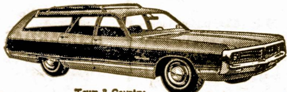
Town & Country

STATION WAGONS — DIDZIAUSIAS PASIRINKIMAS