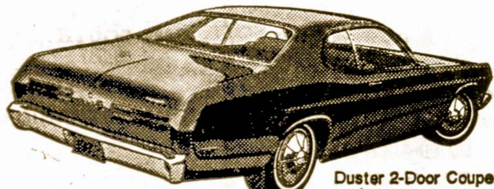
Duster 2-Door Coupe