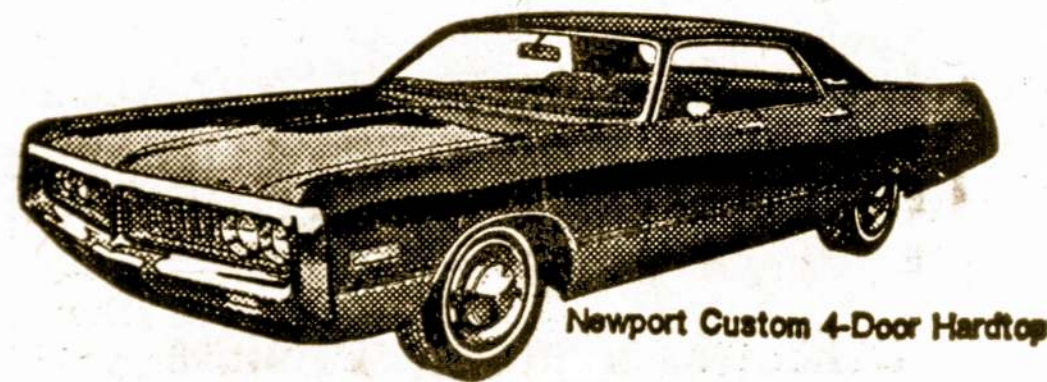
Newport Custom 4-Door Hardtop