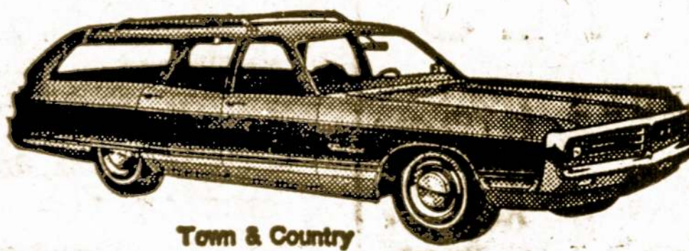
Tom & Country

STATION WAGONS — DIDZIAUSIAS PASIRINKIMAS