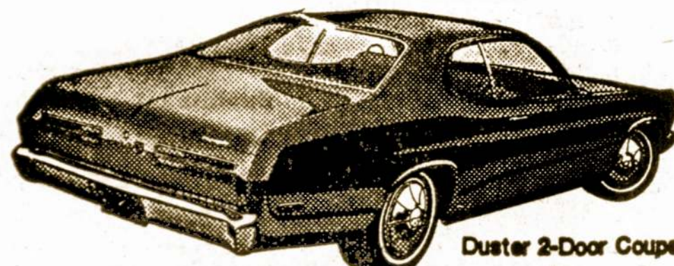
Duster 2-Door Coupe