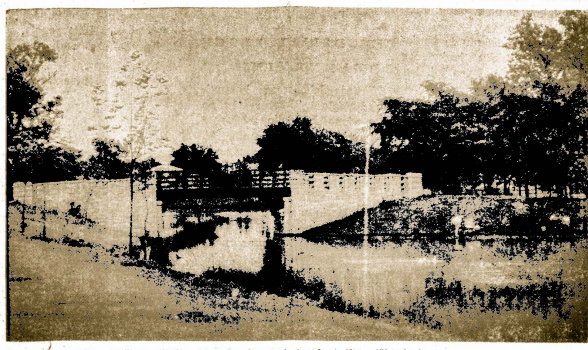
Marquette parko idiliškas tiltelis, kurį kasdien mindo daug lietuviškų kojų.

Britų pro esinė sąjunga piktuoją tmetė Jos Didenybės valdžios planą išvengti infliacijos užsaldyti uždarbius. Profesinei sąjungai priklauso dešimts milijonų įvairių profesijų darbininkų, kurių balsas yra lemiantis vjdaus politikoje. Profesinės sąjungos centras pareiškė, jei vyriausybė imsis įgyvendinti tą planą, bus prieita prie "krūvino maišto".