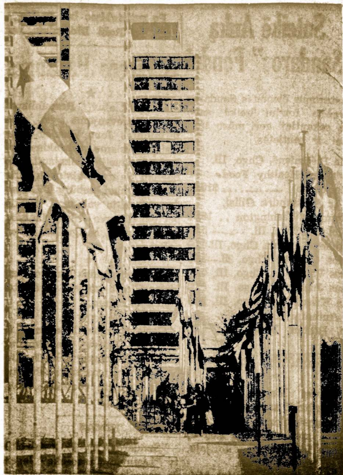
Olimpinis kaimelis, kai dar buvo ramu ir vėliavos nebuvo nuleistos pusiau stiebu.