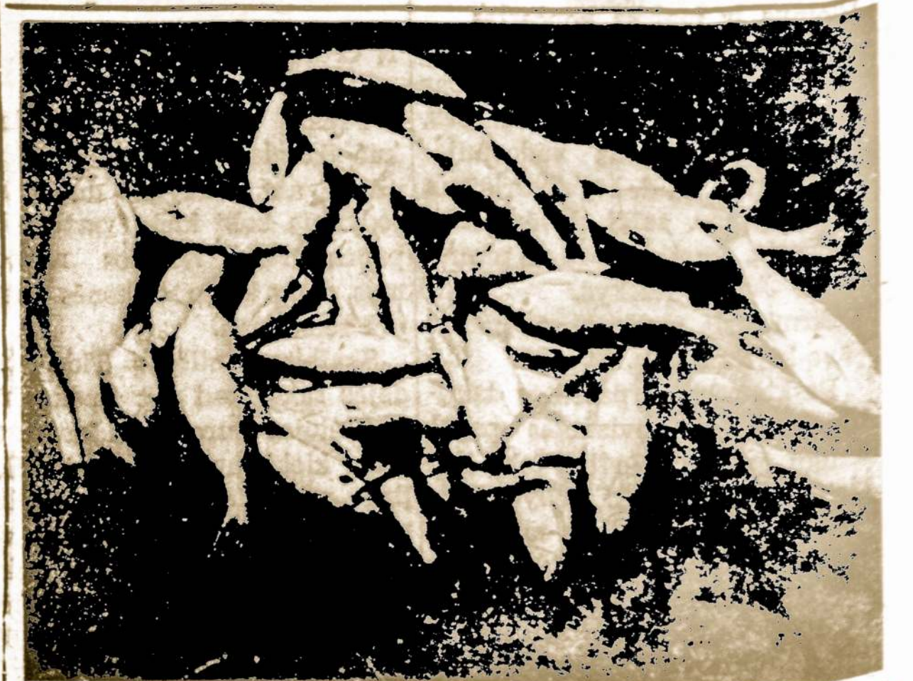
Dėl nešvarumų Volgos upė Rusijoje virto dvokiančiu kanalu ir joje emė trokšti žuvys.

Lietuvoje toks atstumo mata- vimas buvo atliekamas pagal saulės ar dienos laikotarpius.