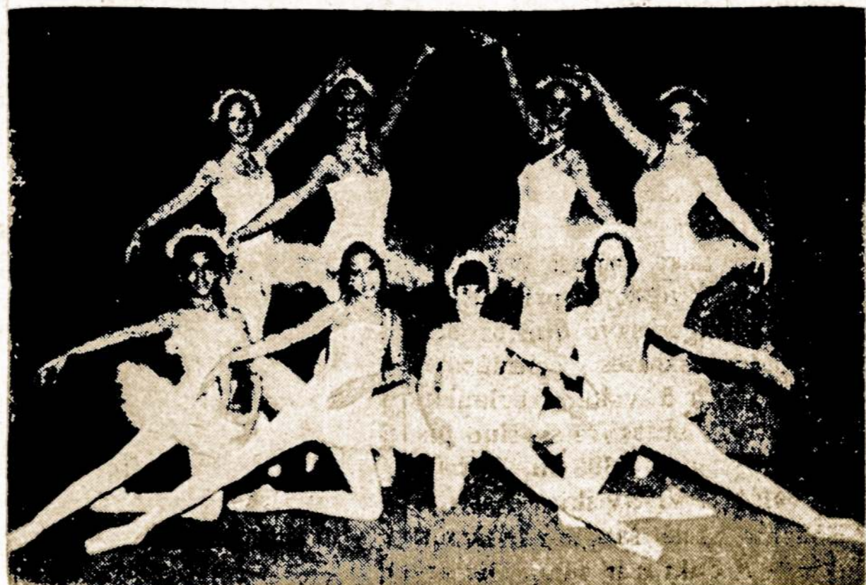
Jaunosios I. Gintautienės baletu studijos šokėjos

Taip esti todėl, jog danties išpūso būna nuodingųjų bakterijų perų, kurie per kraują indėlius į širdį patenka. Širdyje bakterijos susimontuoja prie jos vožtuvų, juos suardo ir to pasėka — širdies liga, kuri vadinasi endocarditis. Taipgi tos bakterijos gali padaryti ir kitokius širdies sutrikimus. Daugiausia sunkumų sudaro, tai proto dantys, kurie yra žandikaulyje užkliuvę ar neįsūdyję išėmimui reikalinga chirurginė operacija, kuri sykais užtrunka 2 ar net daugiau valandų. Po tokios operacijos nuodingųjų bakterijų perai turi laisvas duris į eiti į kraują takus, pakliūti į širdį ir pagaminti širdies ligą. Tos bakterijos gali susikaupti ir kitose kūno dalyse, sudaryti lizdus, nuodingus židinius ir pakenkti visam organizmui. Brangieji, būkime daugiau atsargesni su savo kūno sveikata. Nors syki per metus, padarykime viso kūno ir dantų diagnozę. Tuomet bus mažiau progų, vežti ir širdies ligai veistis, plėsti ir bujoti!