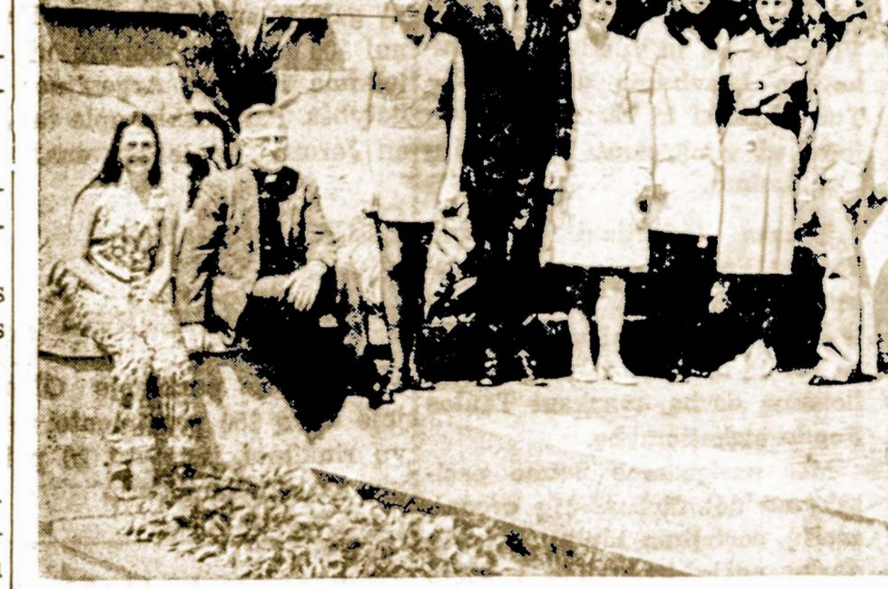
Jaunesniosios lietuvių kartos grupė Madeline, Kolumbijoje. Ateiančiais metais Madeline lietuvių kolonija švęs 25 metų sukaktį.