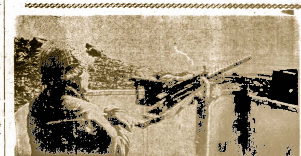
Izraelio karys saugo rubežių

Filipinų prezidentas Marcos painformavo, kad Filipinuose blogėja padėtis dėl pagausėjimo "užsienio agitatorių", kurie kursto į sukilimą musulmonų konfesijos gyventojus pietinėse Filipinų salose.