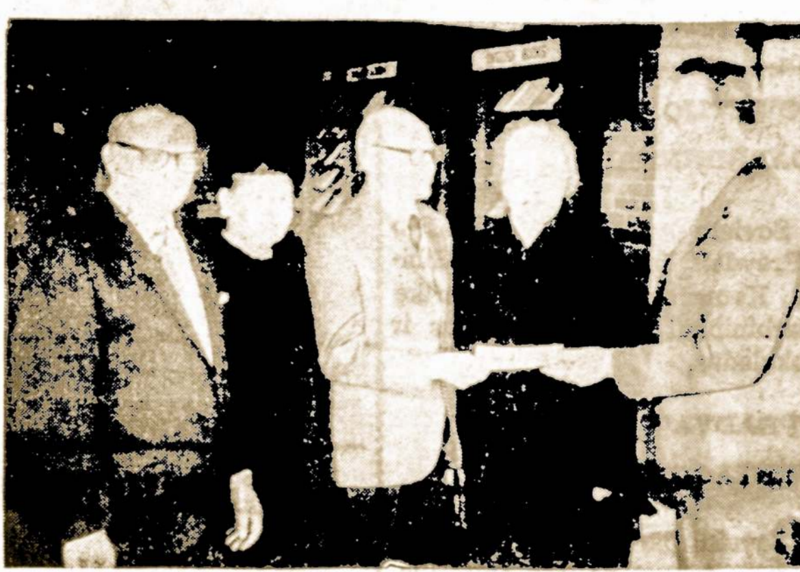
Krakiškių draugiško klubo valdyba įteikia auką.

Krakiškių Draugiškas Klubas vieni kitiems padėti ir remti kultūrinės organizacijos.