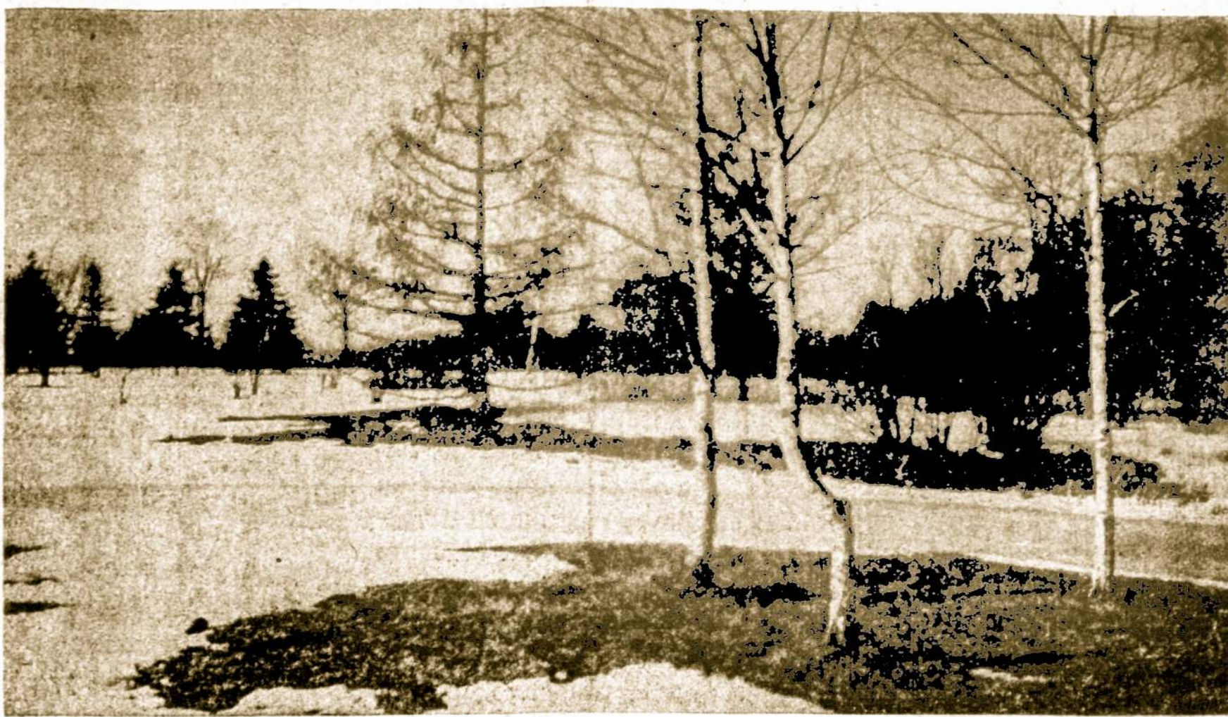
Malonus žiemos vaizdas džiugina širdį.

New York'e Memorial ligoninėje, kurioje vien tik vėžio ligų gydyma, dienos mokytyje yra 212 dolerių.