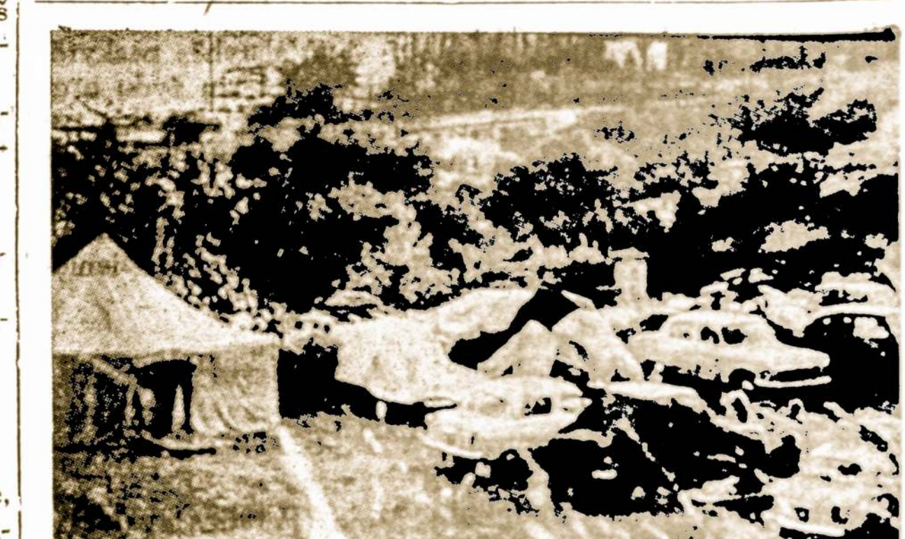
Garstus rusų Socio kurortas prie Juodosios jūros, skirtas bolševikų aristokratai. Tačiau visomis išgalėmis jį veržiasi ir darbininkai.

Rekomendavo tos organizacijos Palos Parko klubas, kurio pirmininke ji buvo du metus.