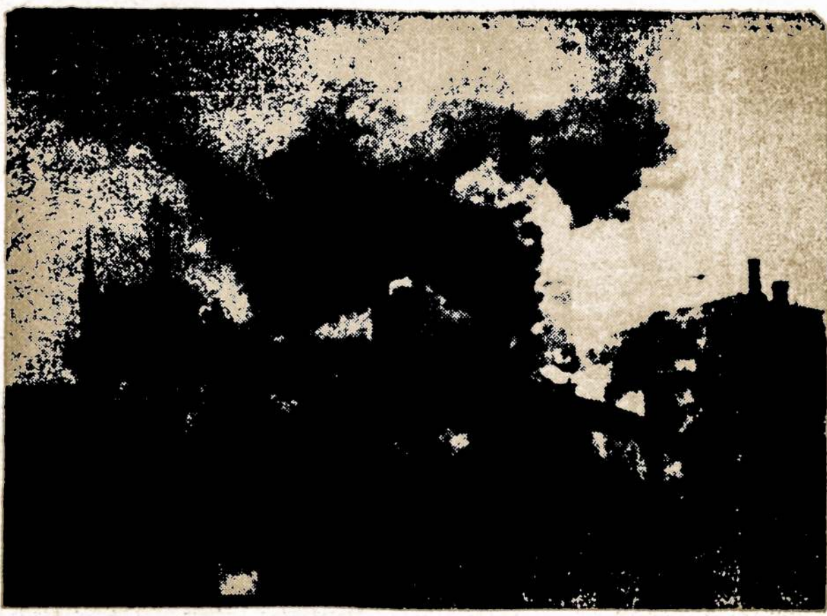
Ankaroj, Turkijoje, taip pat kaip ir kituose miestuose sunku kovoti su oro teršimu. Čia matyti dalis Ankaros.

Atrodo, kad grynai tiesa pareikšta: ypač kas liečia dabartinį ekonominį nuosmukį ir didelį nedarbą pasireiškusi dėlto, kad laikomasi Kremliaus nurodymų.