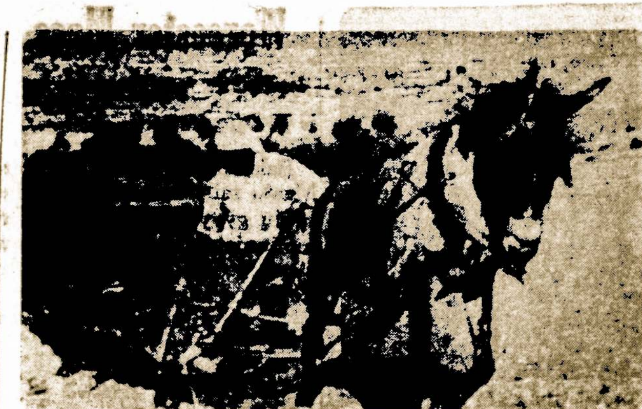
Izraelyje žydų tarpe kyla akcija išpirkti iš arabų ūkininkų žemes. Tik paskutinių metų bėgyje žemės kainos pakilo 5 kartus. Arabai ūkininkai. Arabų lygos šalių raginami, atsisako parduoti savo žemę ir ramiai dirba laukus

Jeigu palengva, tai pirmiausiai darosi piktas, skauda galva (kaip kada skauda pilvas), veidas išbala, ant kakto šaltas prakaitas, akys apstemta, užia auštas dreba kojos ir rankos, sunkus kvėpavimas, tik kraujo (stoka tam tik-