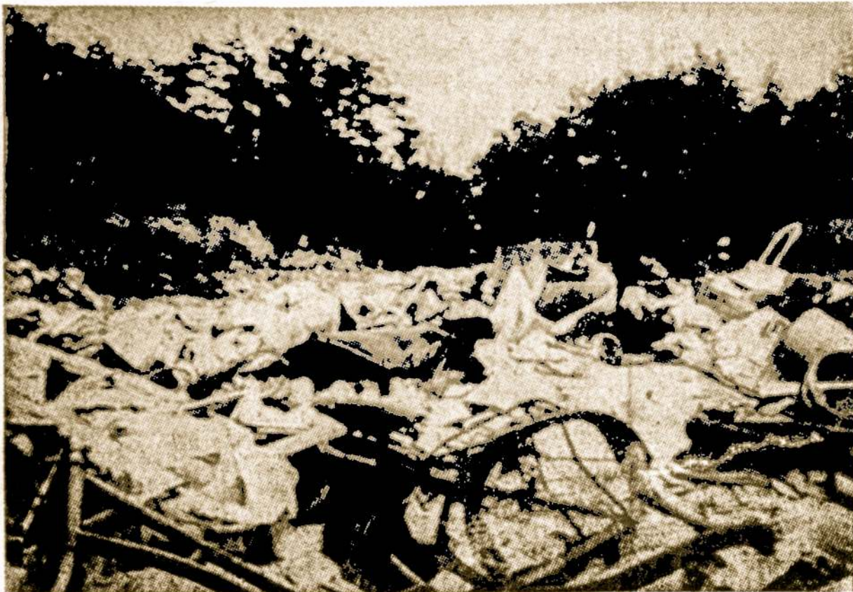
Vakarų Vokietija susirūpino savo gražiųjų miškų išvalymu, kurie pokario metais daug kur virto šiukšlynais

nustebinta, kad tą filmą parodė ir kiti Chicagos komerciniai kinai, išskiriant North Lincoln Avenue nuotykių Three Penny kino teatrą. pr. š.