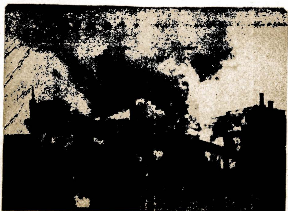
Ankaroje, Turkijoje, taip pat kaip ir kituose miestuose sunku kovoti su oro teršimu. Čia matyti dalis Ankaros.

Daugiau smagumo yra mylėti, negu būti mylimam.