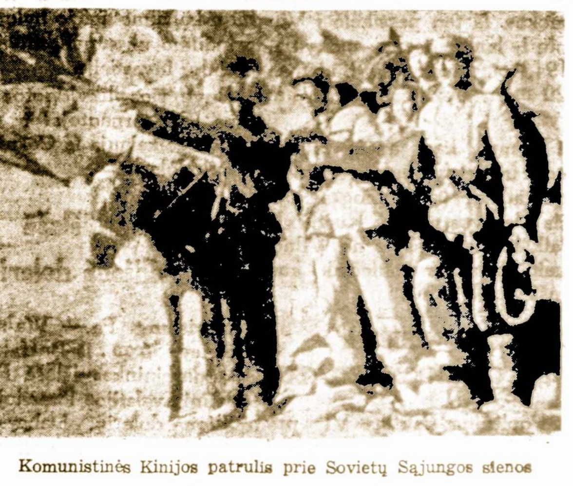
Komunistinės Kinijos patrulis prie Sovietų Sąjungos stenos

— Iš kur aš apie tai į giliu žinoti? Aš visą laiką buvau iš-tikima savo vyrui.