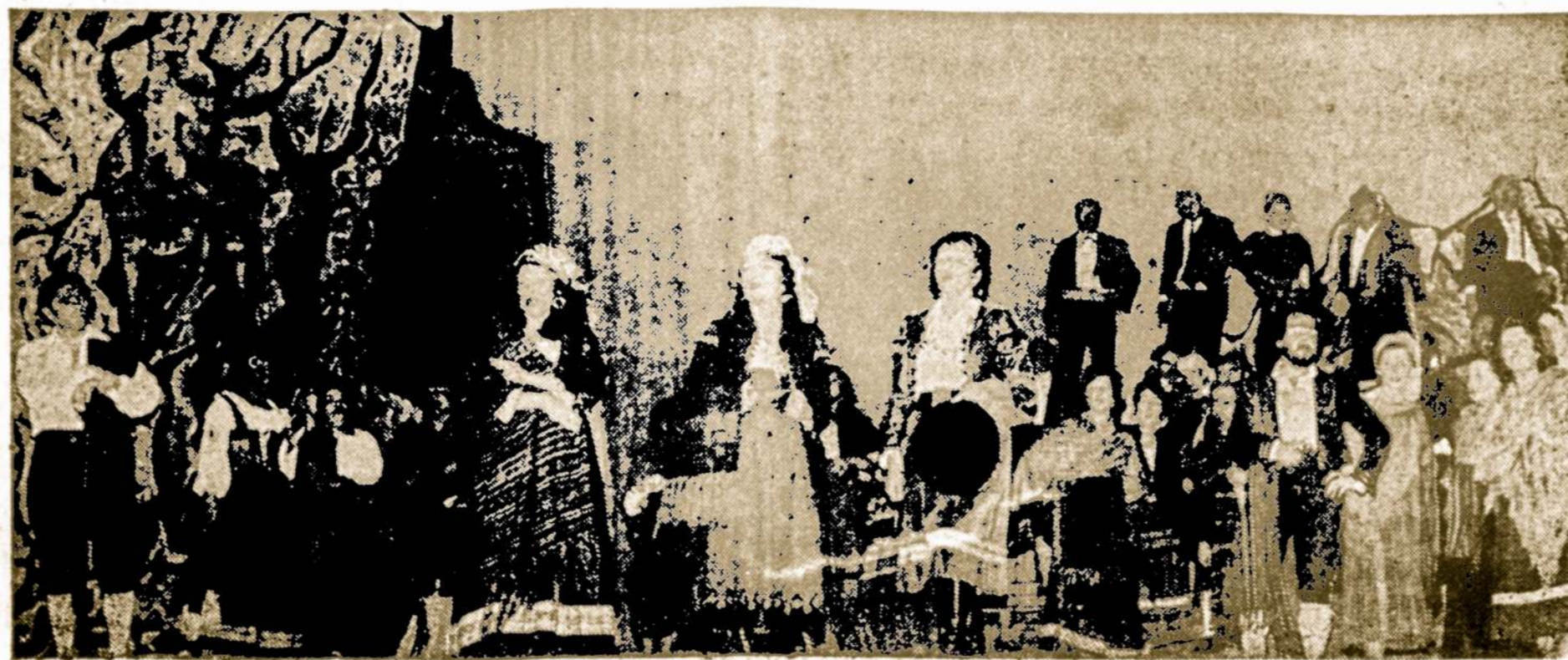
Iš Lietuvių operos Carmen pastatymo Chicagoje.